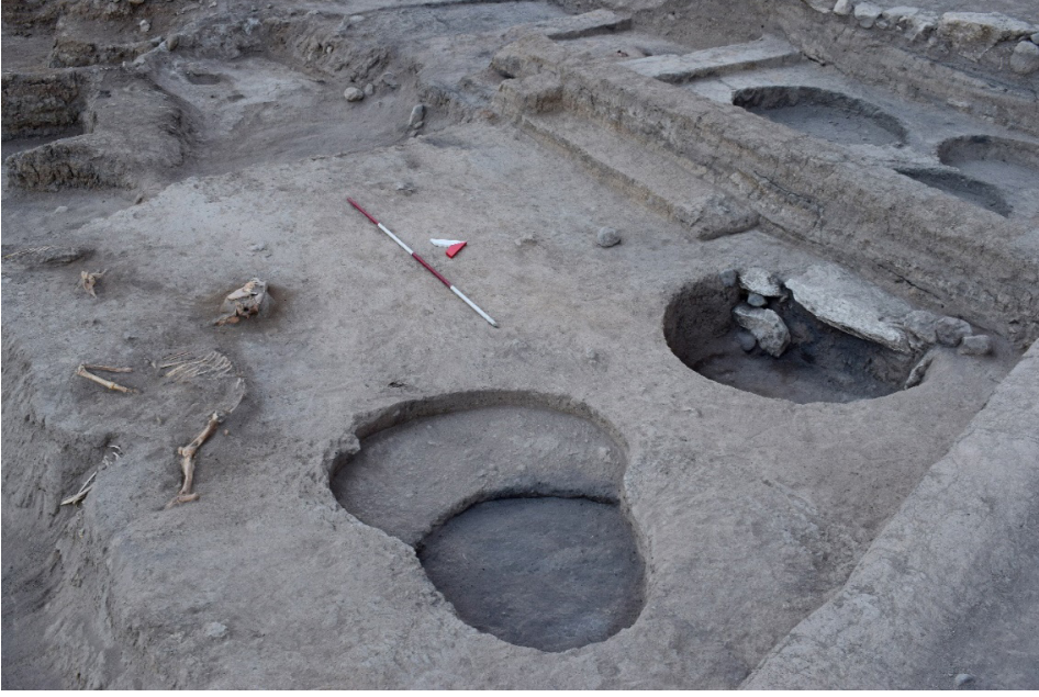
Resim 7: Kırmızı haçli çanağın buluntu yeri