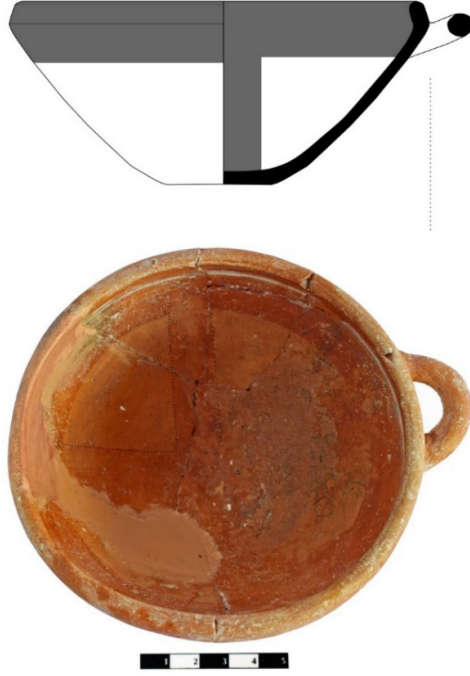
Resim 8: Kırmızı haç motifli Acemhöyük çanağı