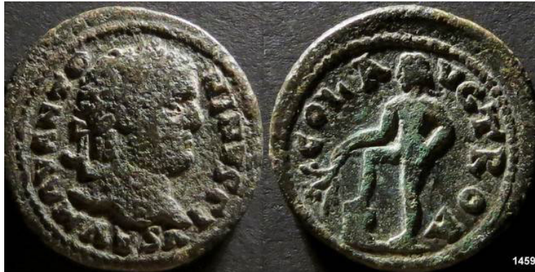
Resim 4. Alexandria Troas Sikkesi, AE, (İmp. Caracalla). ( https://www.wildwinds.com/coins/ric/caracalla/_alexandriaTroas_Lindgren_A334A.jpg )