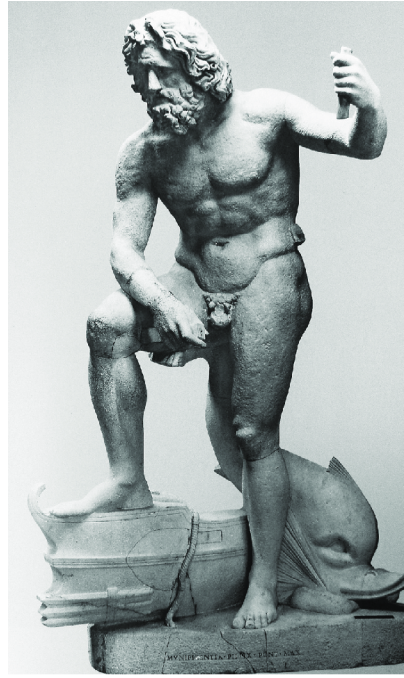
Resim 5. Lateran Poseidon, Vatican Müzesi, MS 160 (Katsonopoulos 2017, 23, Fig. 5).