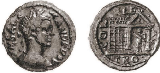
Resim 3b. Alexandria Troas Sikkesi, AE, MS 222-235 (İmp. Severus Alexander).