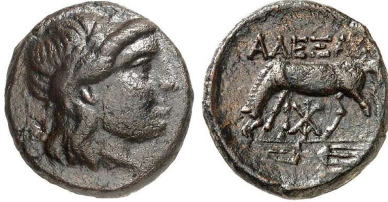
Resim 2a. Alexandria Troas Sikkesi, AE, MÖ 261-246.