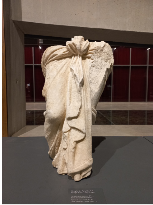
Resim 7. Aphrodite Anadyomene Torsosu, Troya Müzesi.