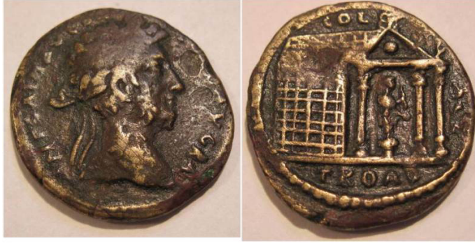
Resim 3a. Alexandria Troas Sikkesi, AE, MS 184-192 (İmp. Commodus). ( https://www.wildwinds.com/coins/ric/commodus/_alexandriaTroas_SNGRighetti_775.jpg )