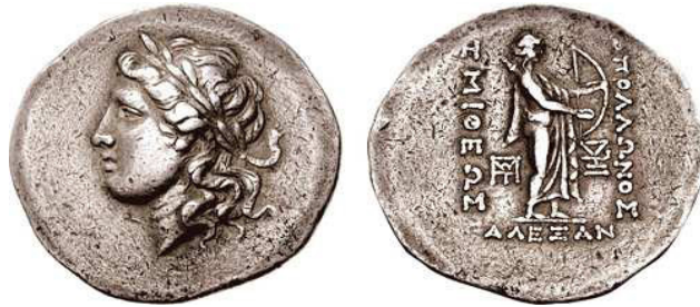
Resim 2b. Alexandria Troas Sikkesi, AR, Tetradrachmi, MÖ 188-133.