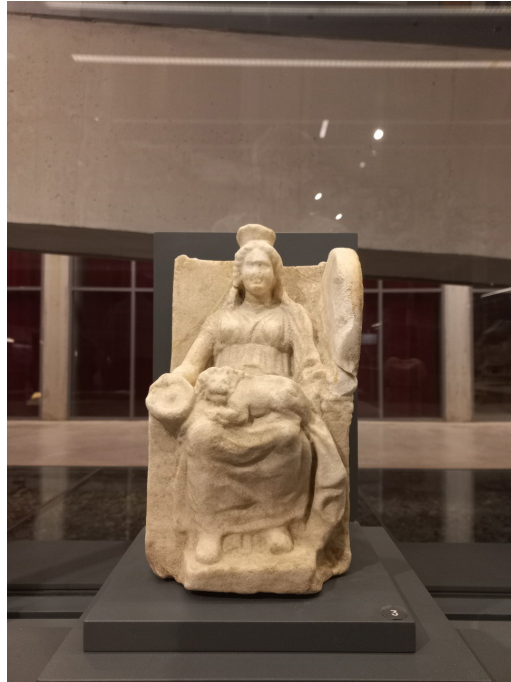
Resim 8. Oturan Kybele Heykelciğı, Troya Müzesi.