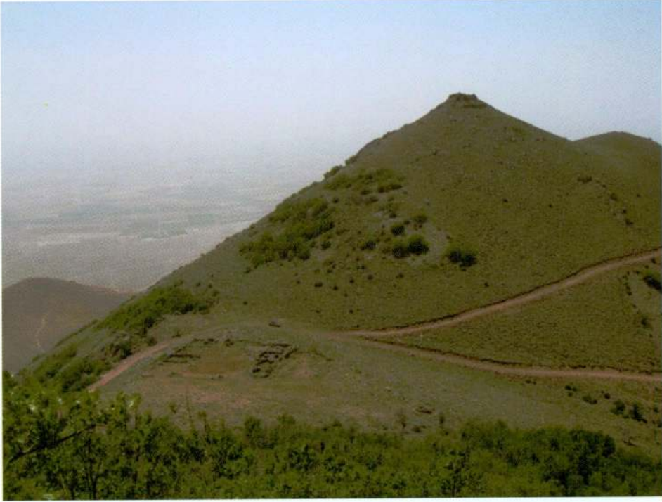
Resim 27. Başdağ, güney yapısının konumu.