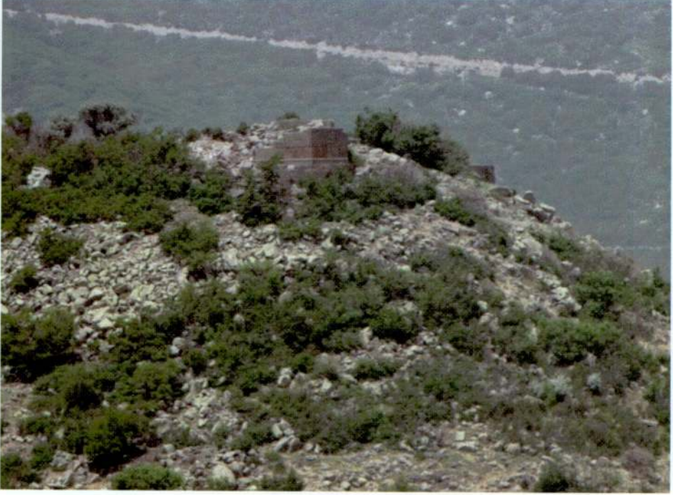
Resim 21. Başdağ, kuzey kalesi.