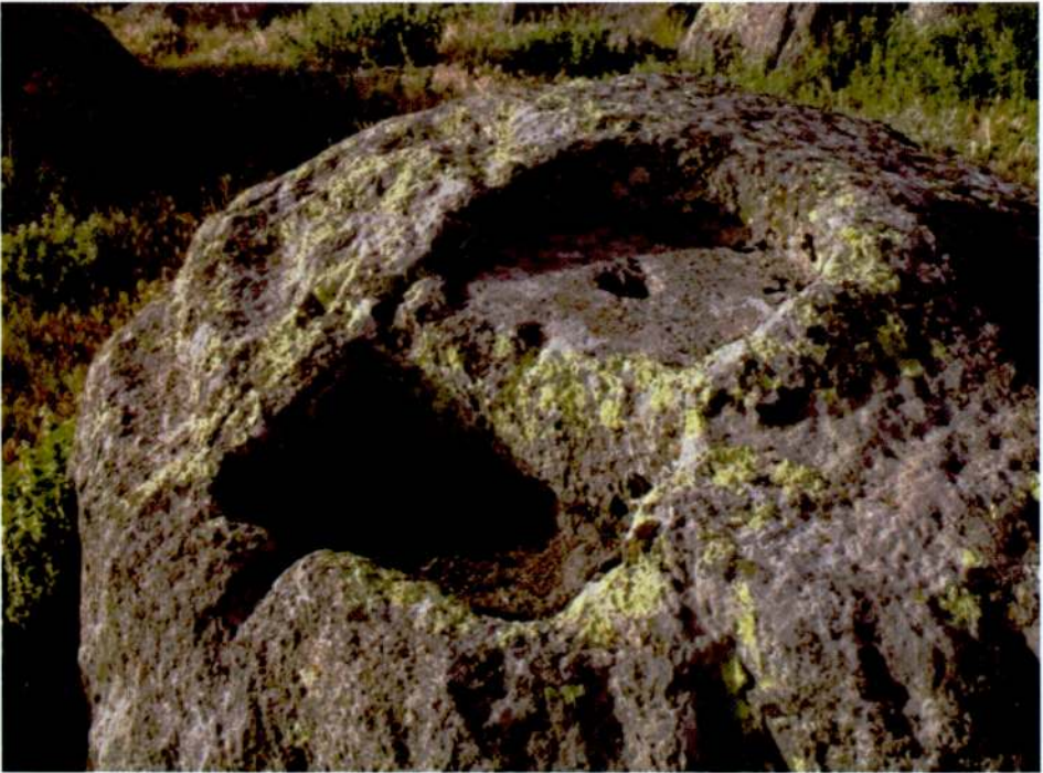
Resim 14. Candar Tepesi, kaya döşemi.