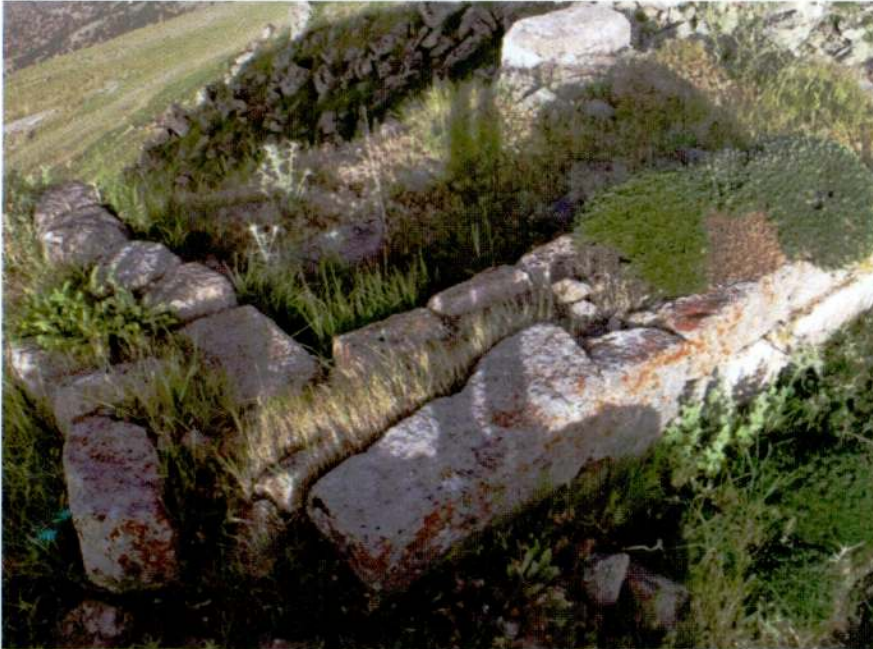
Resim 12. Candar Tepesi, bir yapıya ait temel izleri.