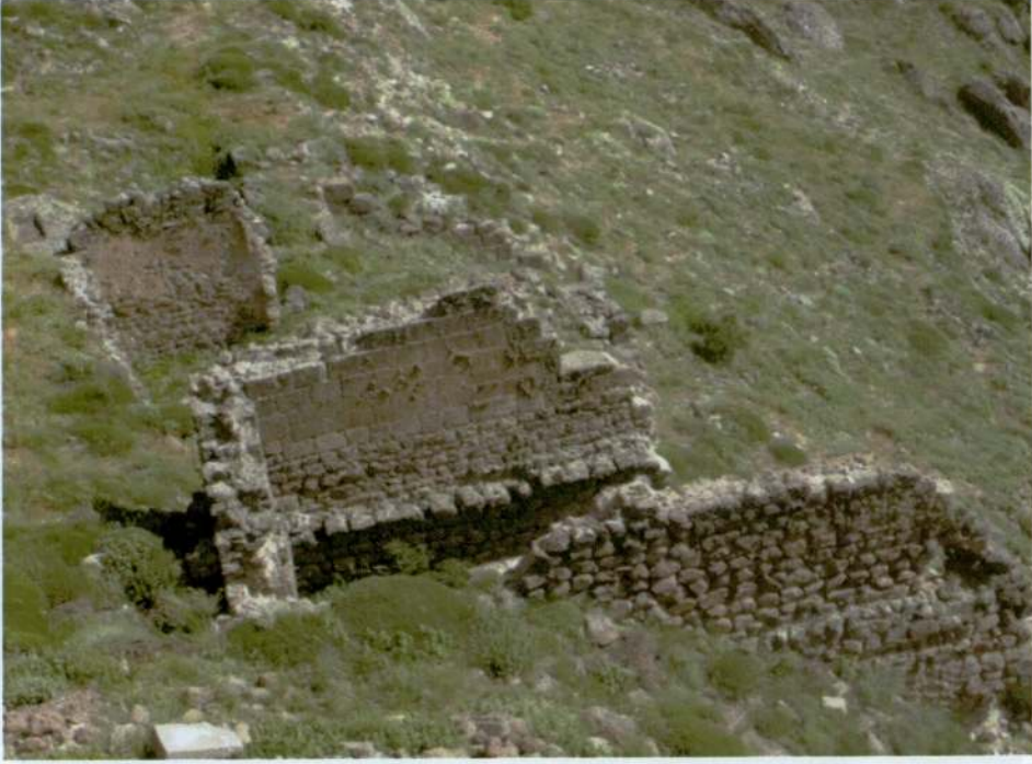
Resim 19. Kızılhisar Tepesi, yapı kalıntısı.