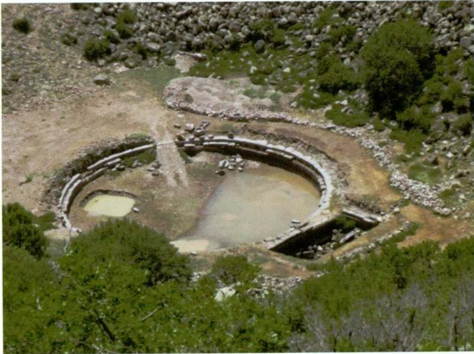
Resim 28. Başdağ, havuz yapısı.