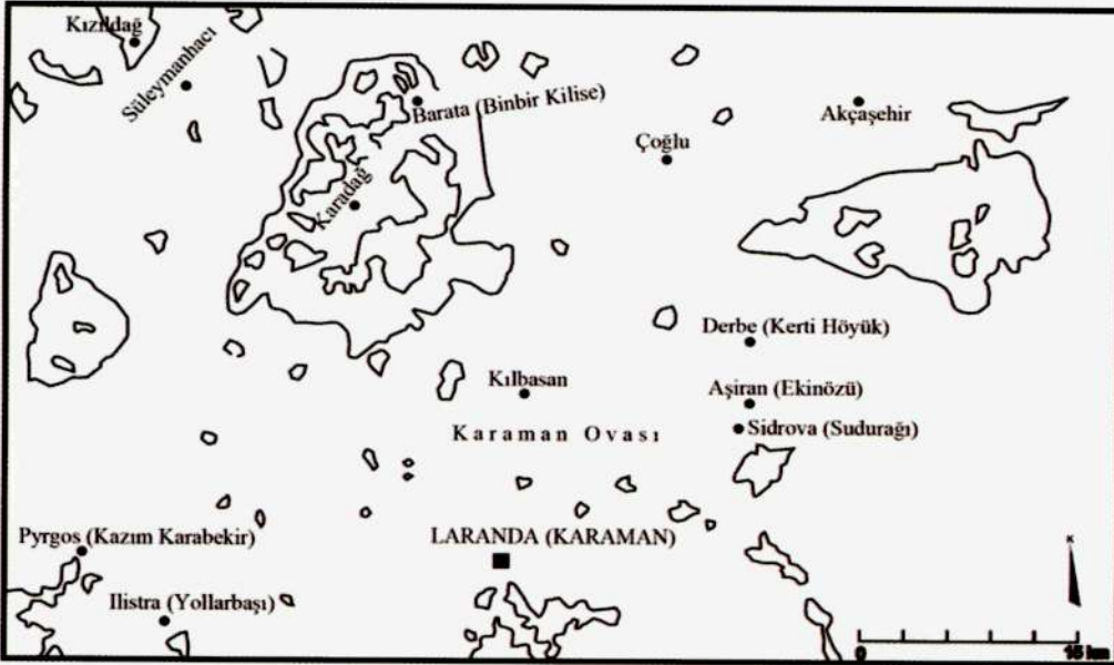
Harita 2: Karadağ ve Lykaonia'nın Güneyi.