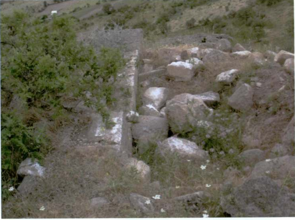
Resim 5. Kayasarnıç tepesi, bir yapıya ait temel kalıntıları.