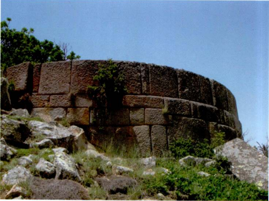
Resim 22. Başdağ, kuzey kalesinden burç.