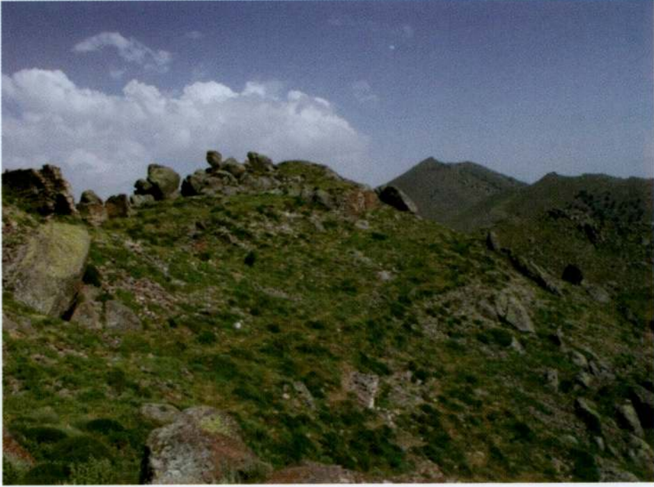
Resim 15. Kızılhisar Tepesi, genel görünüm.