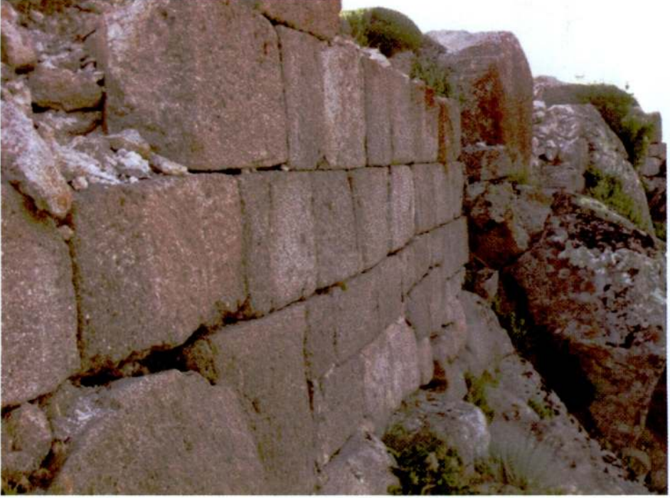
Resim 13. Candar Tepesi, kale duvarı.