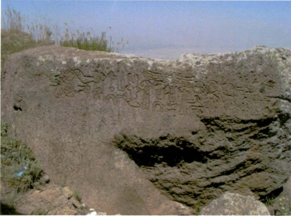
Resim 8. Mahalaç Tepesi, Karadağ 1 Yazıtı.