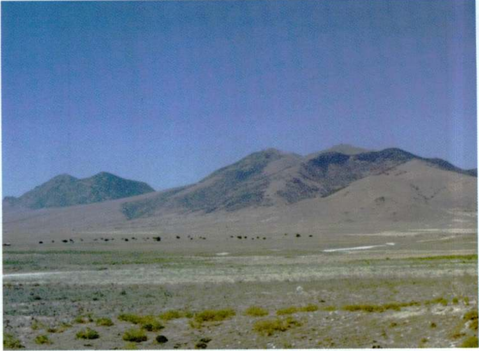
Resim 1. Karadağ'ın güneyden genel görünümü.