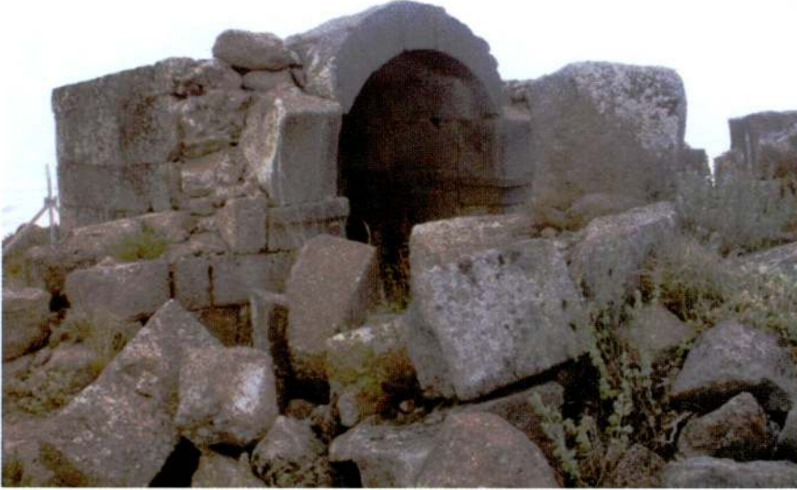
Resim 11. Mahalaç Tepesi, mezar şapeli.