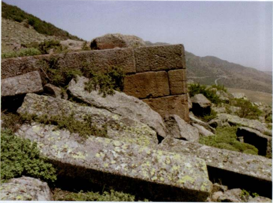
Resim 25. Başdağ, bina kalıntısından detay.