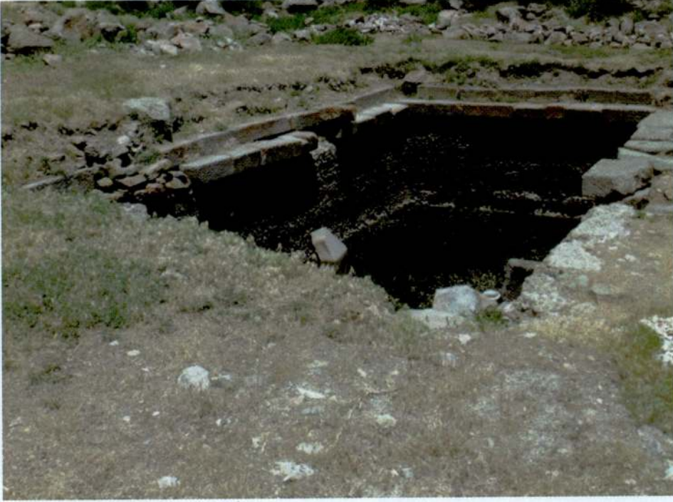
Resim 23. Başdağ, sarnıç yapısı.