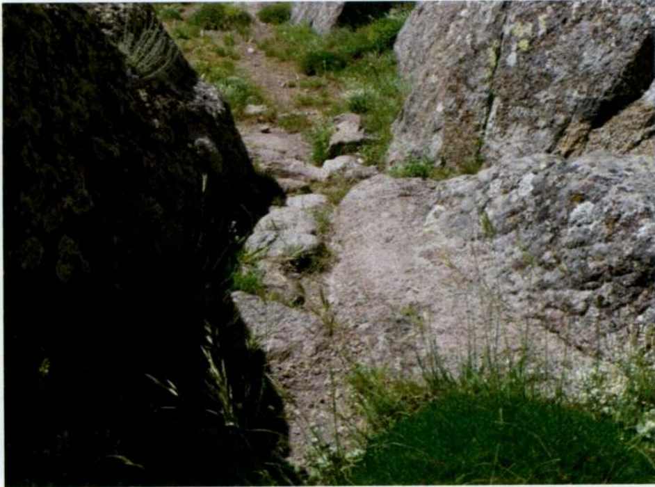
Resim 16. Kızılhisar Tepesi, kalıntular sahasına çıkan kaya kesme yol.