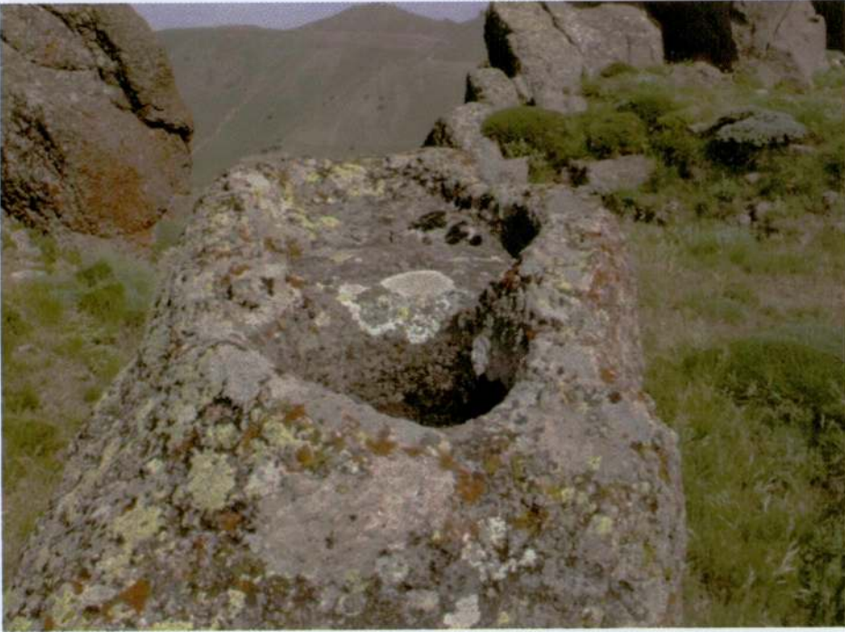
Resim 20. Kızılhisar Tepesi, kaya döşemi.