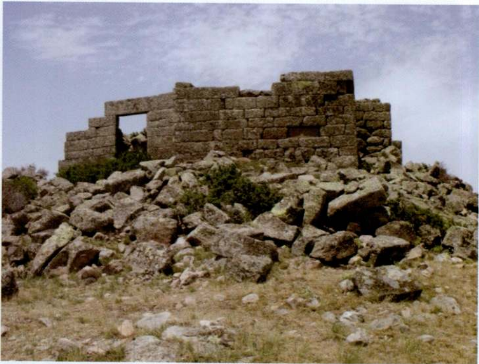
Resim 26. Başdağ, güney yapısı.