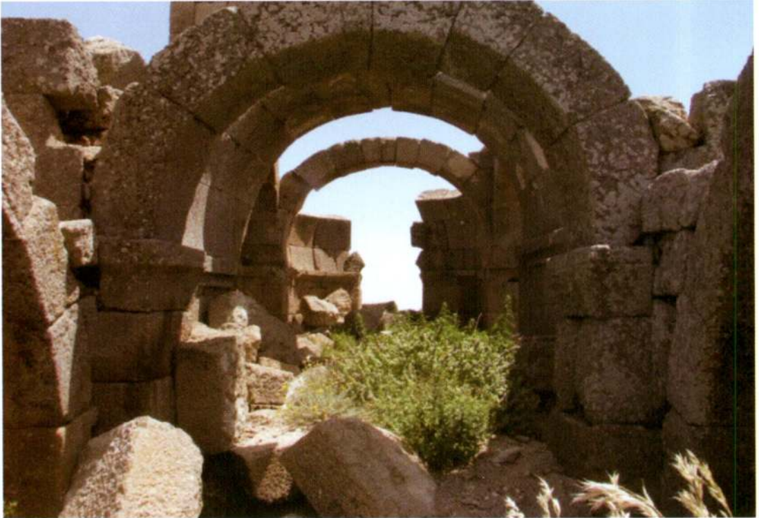
Resim 10. Mahalaç Kilisesi'nden görünüm.