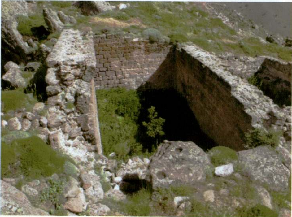
Resim 18. Kızılhisar Tepesi, ifte sarnı.