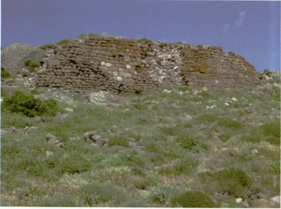
Resim 17. Kızılhisar Tepesi, istinat duvarları