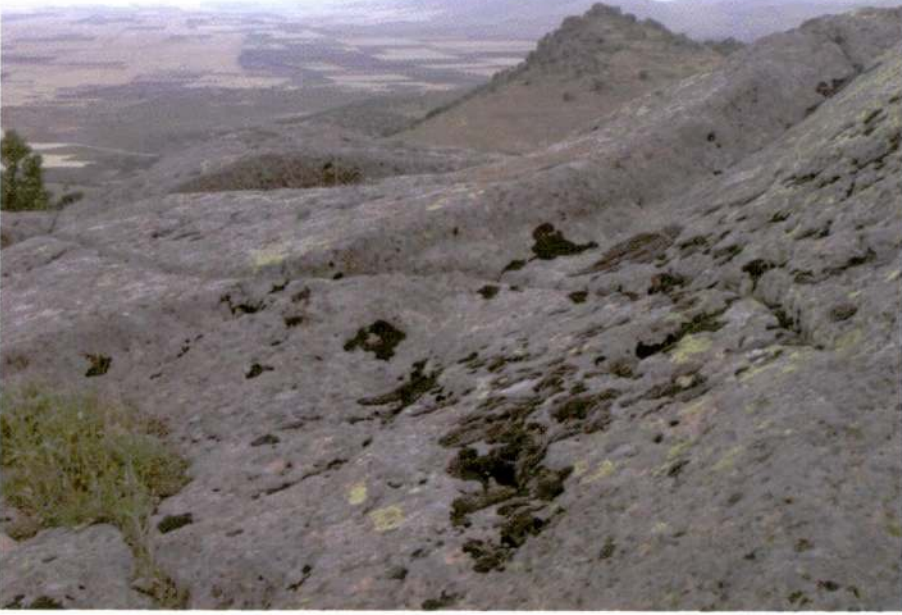
Resim 7. Kayasarnıç Tepesi, ana kayaya açılmış sarnıç yapısına ait akıtma kanalcıkları.