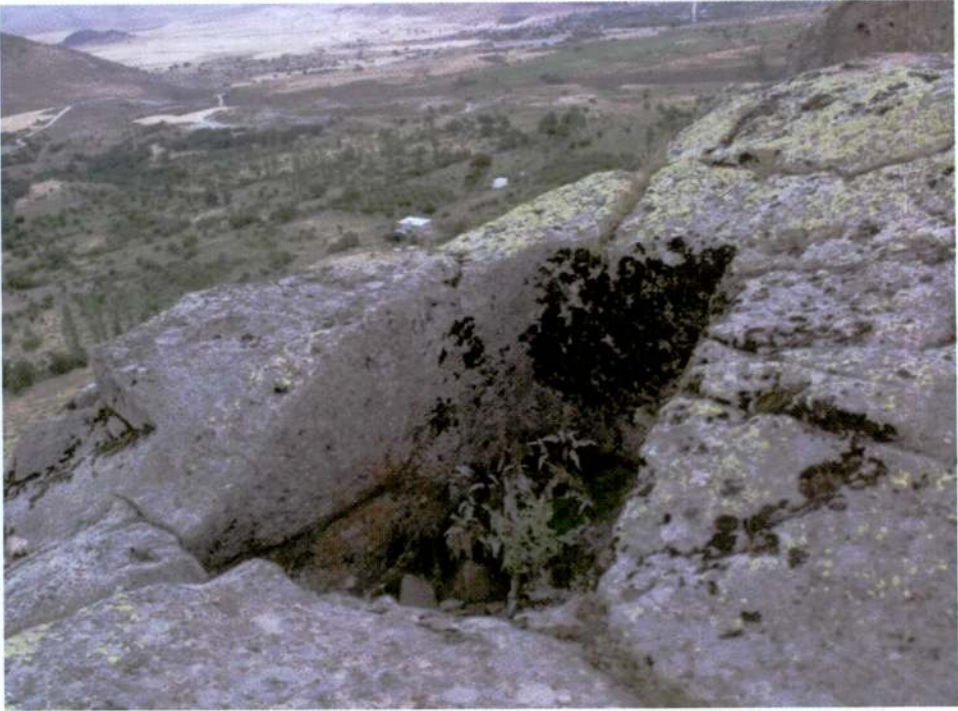
Resim 6. Kayasarnıç Tepesi, ana kayaya açılmış sarnıç.