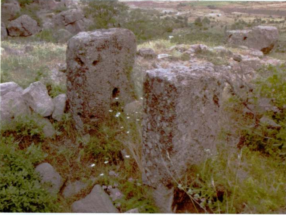
Resim 3. Kayasarnıç Tepesi, bir kiliseye ait kapı söveleri.