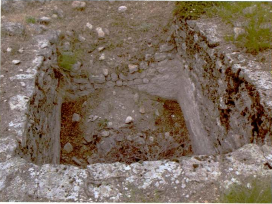
Resim 4. Kayasarnıç Tepesi, sarnıç yapısı.