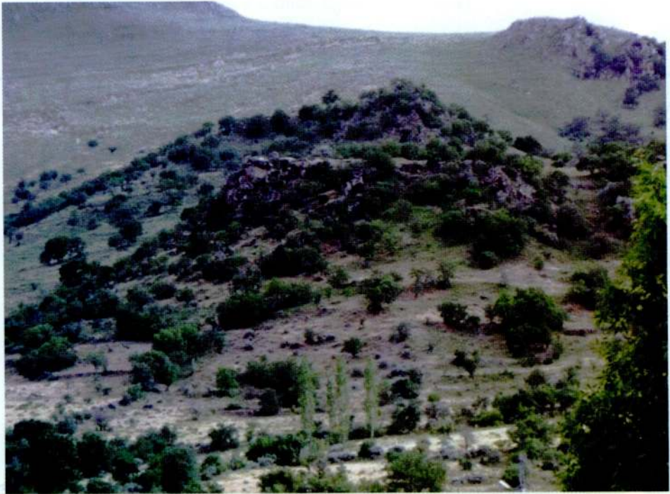
Resim 2. Kayasarmıç Tepesi kalıntılar sahasının genel görünümü.