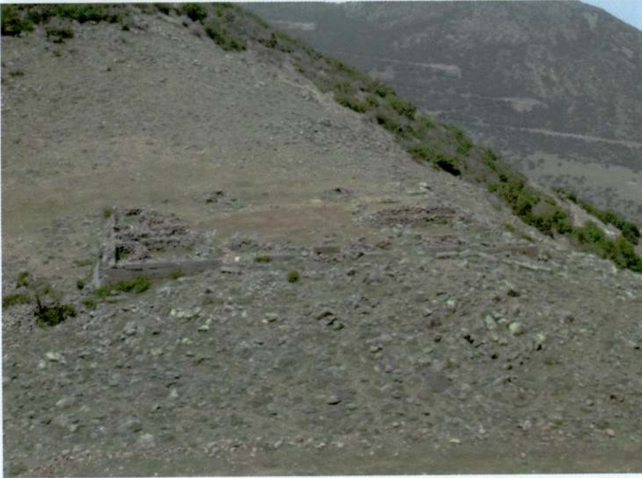
Resim 24. Başdağ, bina kalıntısının genel görünümü.