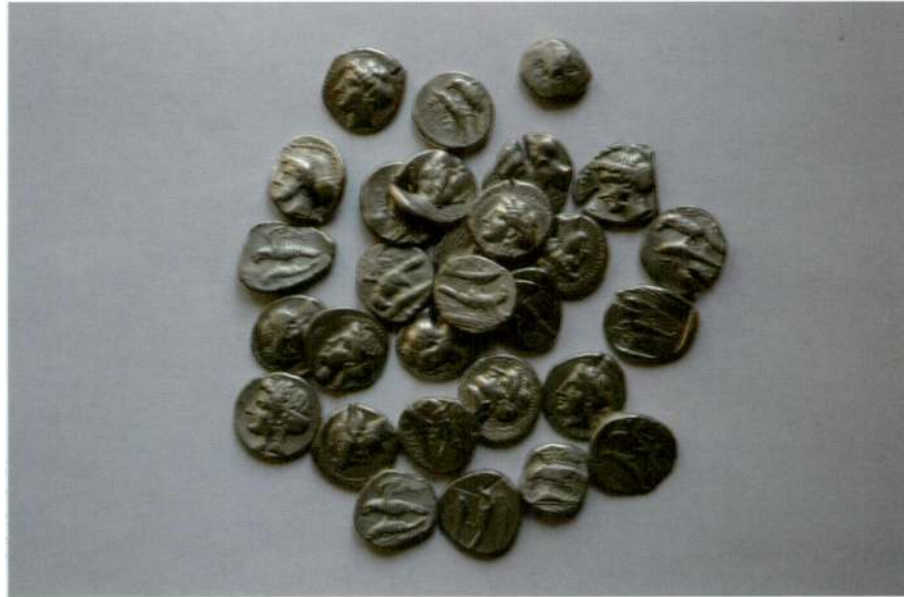
B: Definenin Konvervasyon Sonrası Durumu