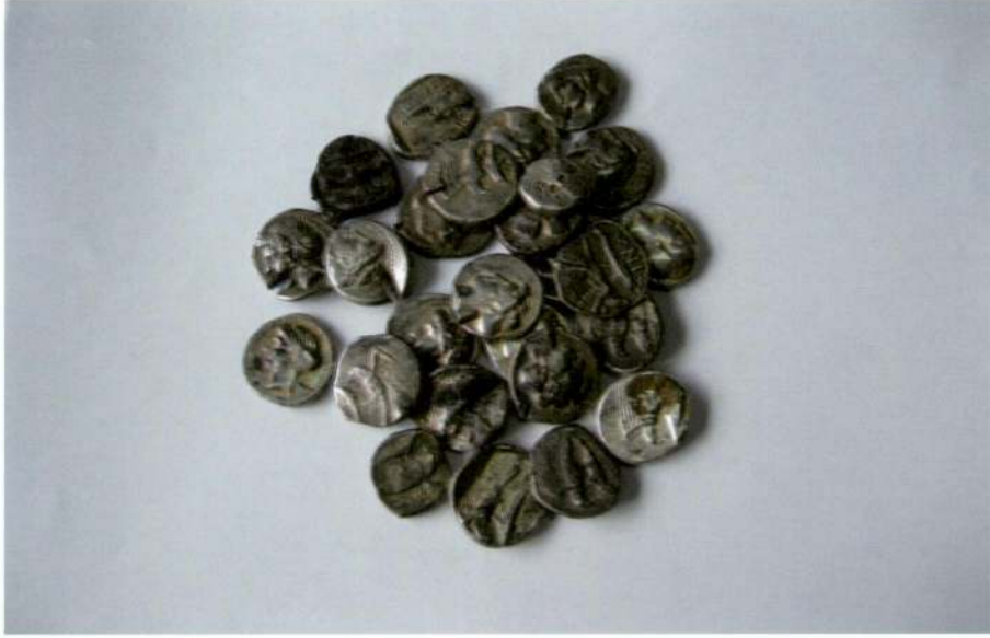
A: Definenin Konvervasyon Öncesi Durumu