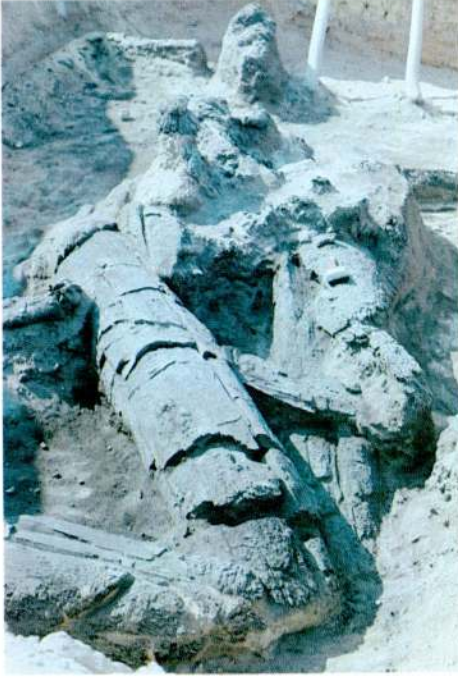
Res. 3 - Sarıkaya Sarayı yanmış direk kalıntıları.