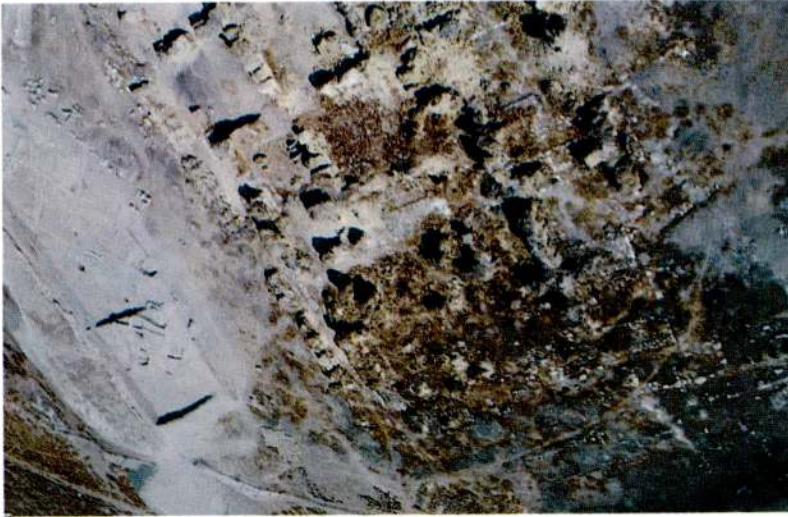
Res. 4 - Sarıkaya Sarayı ve kuzey avlusundaki Hellenistik kalıntılar.