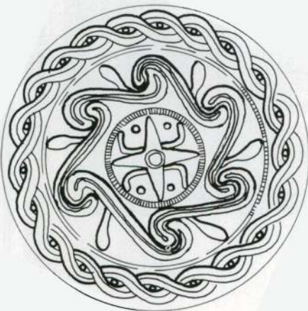
Ac. 88 - 13