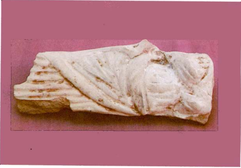
Res. 2 - Hellenistik pişmiş toprak figürin.