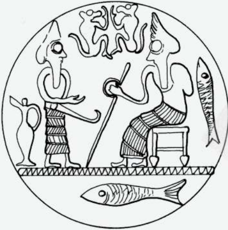
Ac. 88 - 10