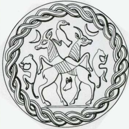
Ac. 88 - 6, 7