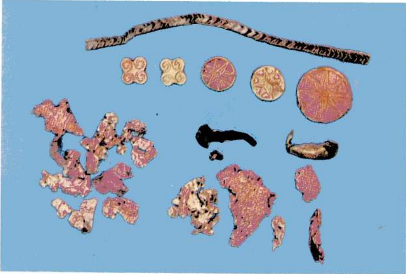
Res. 1 - Sarıkaya Sarayı altın süs eşyası.