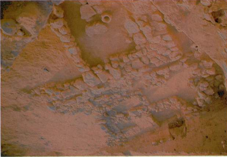
Res. 2 - Kuzey terası III. tabaka mimari kalıntıları.