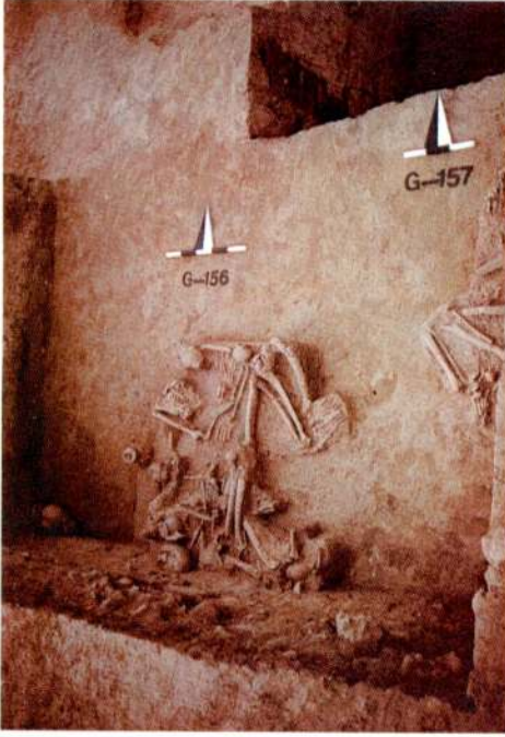
Res. 3 - M.Ö. 3 bin mezarlığından bir görünüş.