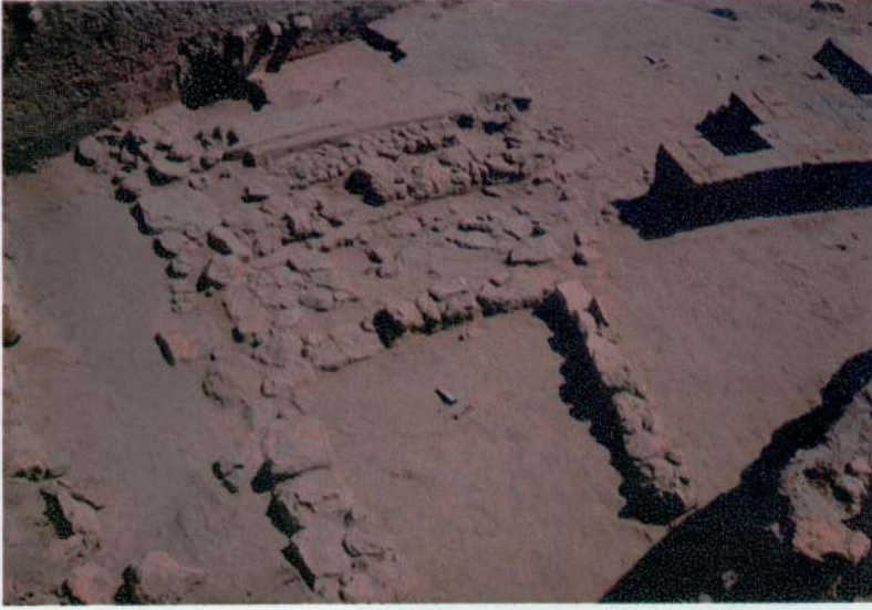
Res. 1 - Kuzey terası II. tabaka mimari kalıntıları.