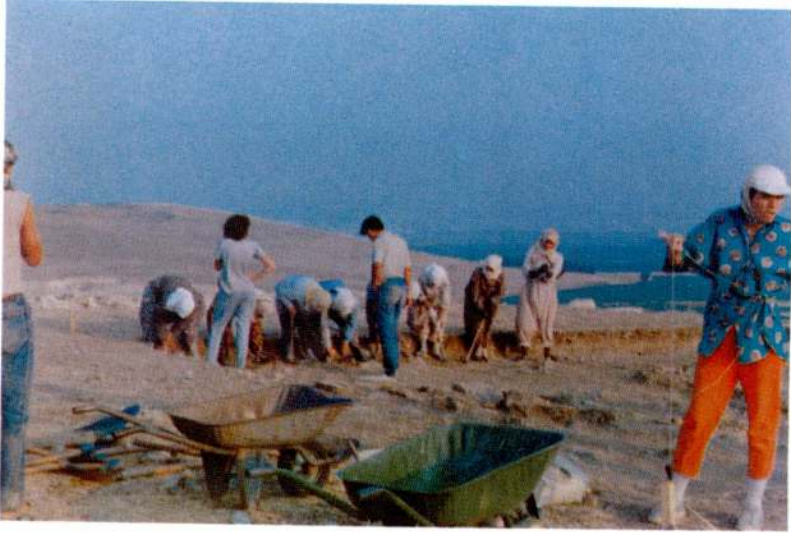
Res. 4 - Kadın işçilerle çalışma.