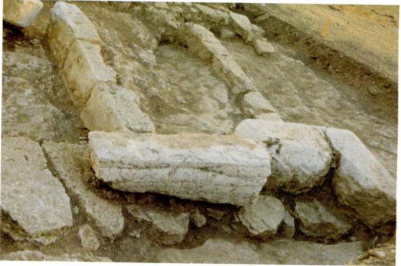
Res. 8 - Güney kazı alanı taş temel yapısının bağlantıları.