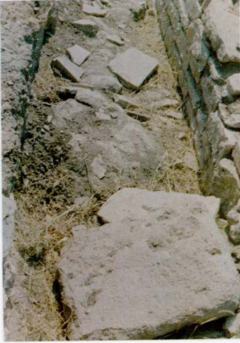
Res. 1 - Kazı alanında yapılan tahribat.