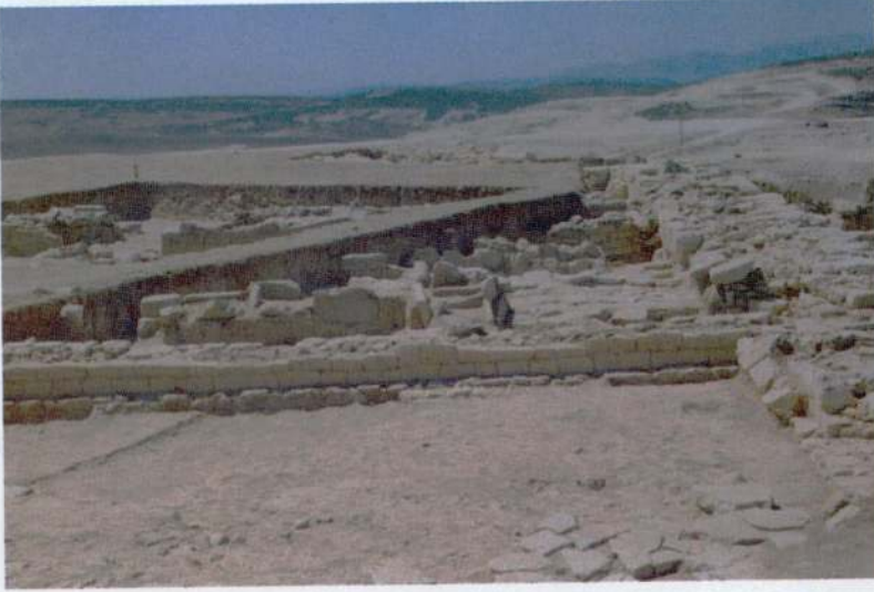
Res. 5 - Kuzey kazı alanı ve Arkâik yapılaşma.