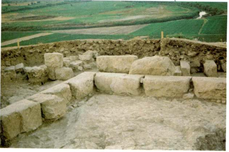
Res. 7 - Güney kazı alanı taş temel yapısının bir köşesi.