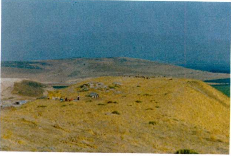
Res. 3 - Panaztepe kuzey kazı alanına güneyden bakış.