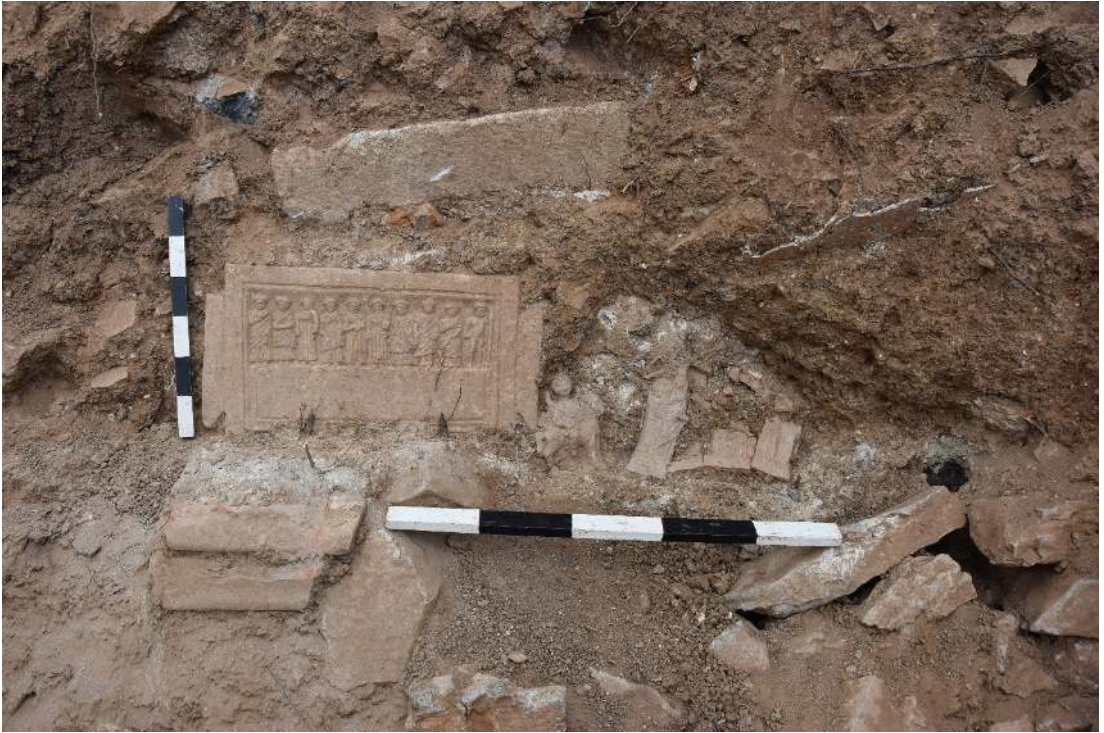
Resim 8: 5 No.lu Hazine Binasının sekisi.