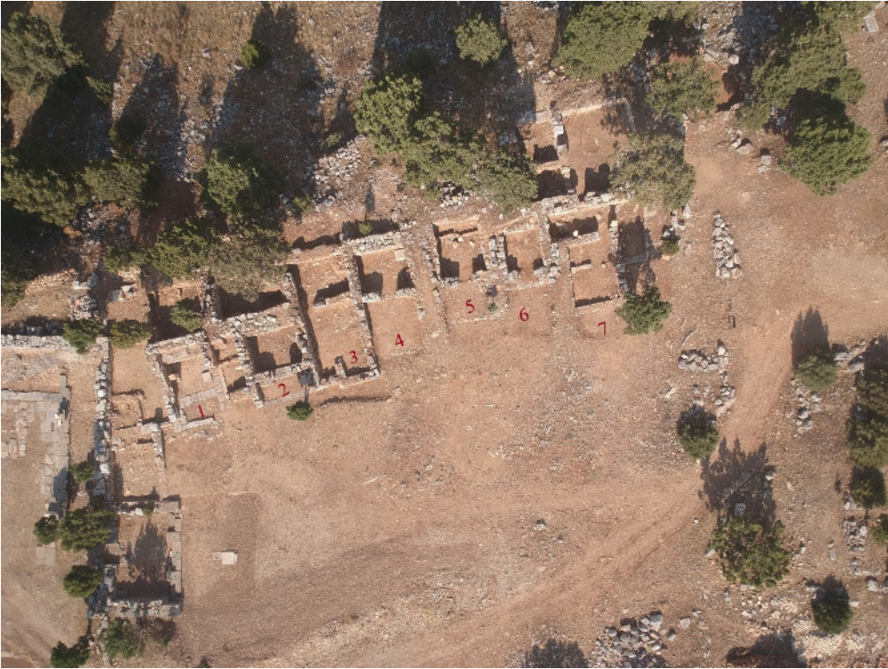
Resim 4: Hazine Binaları.