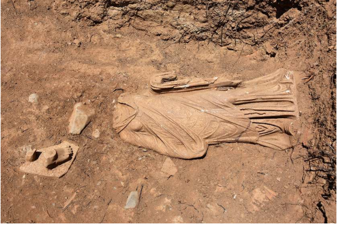
Resim 11: Kadın heykeli.