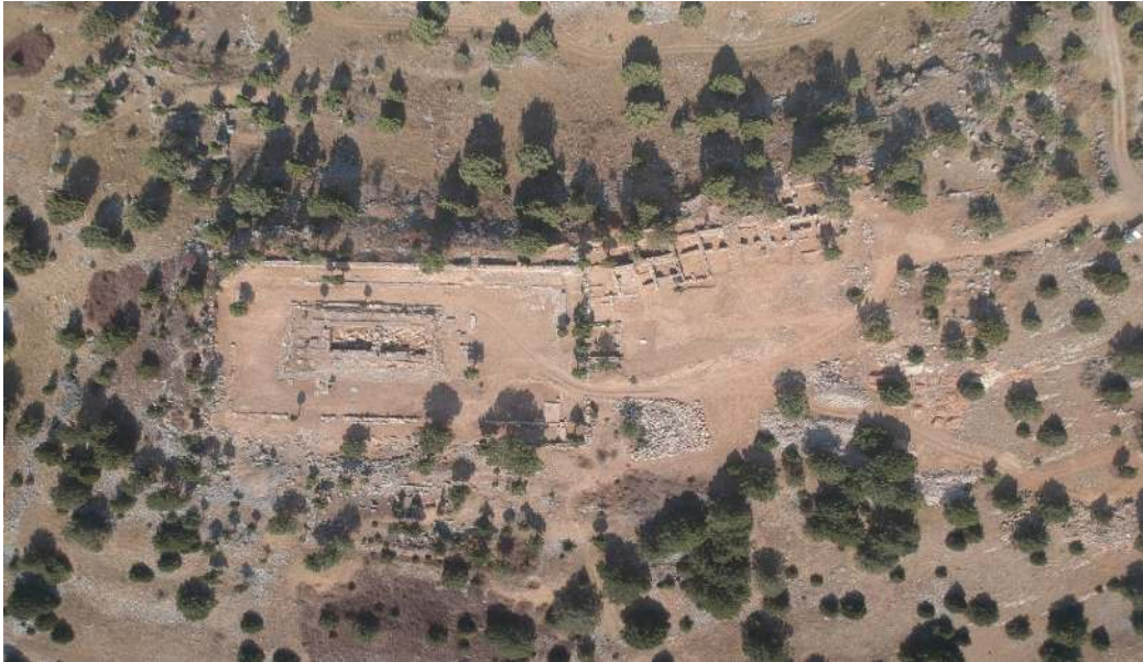
Resim 2: Tapınak ve Hazine Binaları.