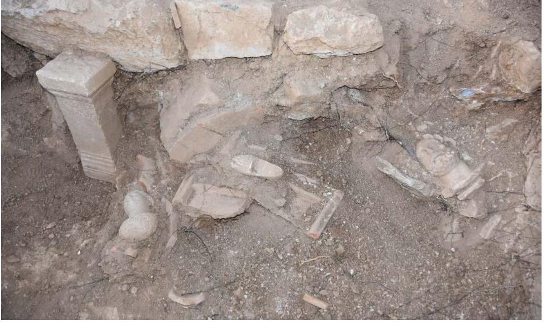
Resim 9: 6 No.lu Hazine Binasının buluntu durumu.