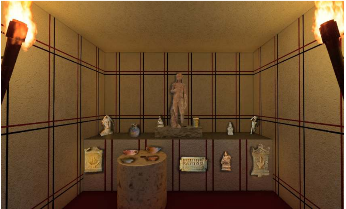
Resim 6: 5 No.lu Hazine Binasının düzenlenmesi.