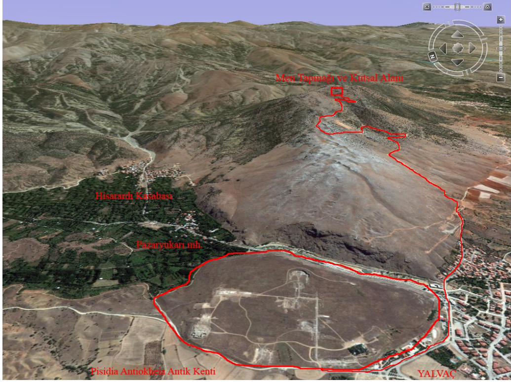
Resim 1: Pisidia Antiokheiası, Men Tapınağı ve Kutsal Alanı.