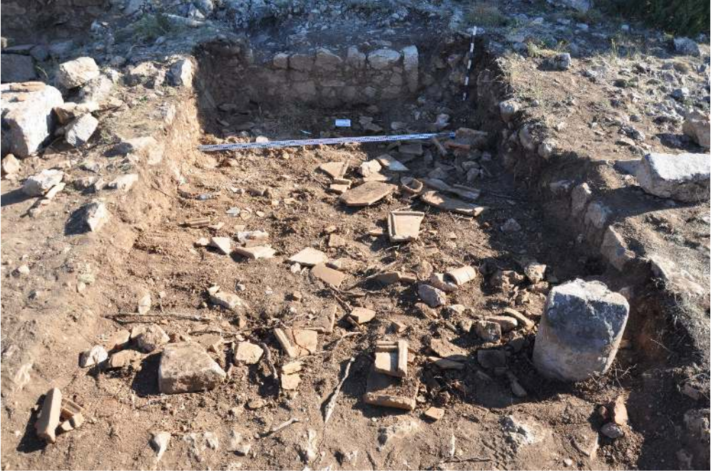
Resim 3: Çatı Kiremitleri.