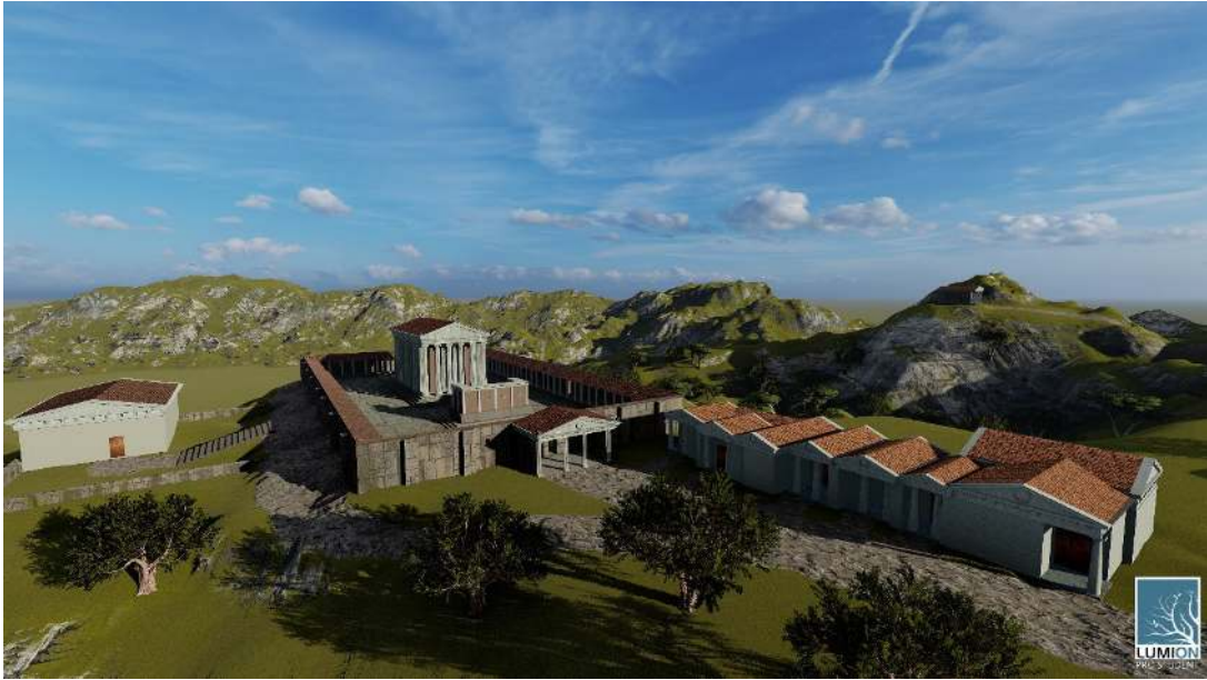
Resim 14: Tapınağın ve Hazine Binalarının canlandırılması.