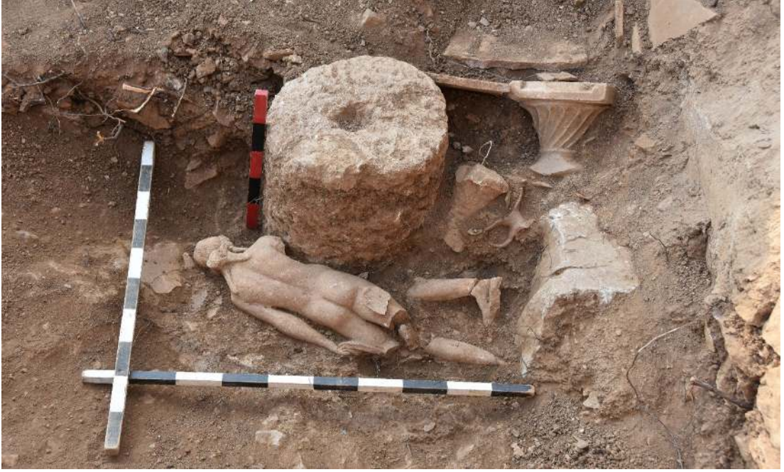
Resim 7: Apollon Heykeli.