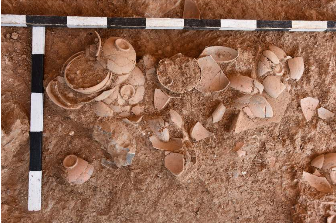
Resim 12: Seramiklerin buluntu durumu.