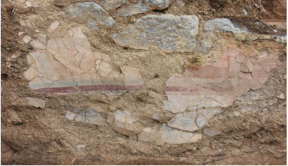
Resim 5: Duvar Sıvası.