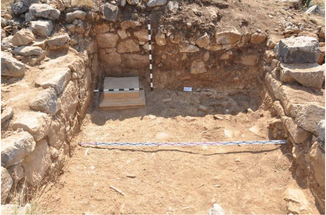
Resim 10: Yarım işçilikli althk.