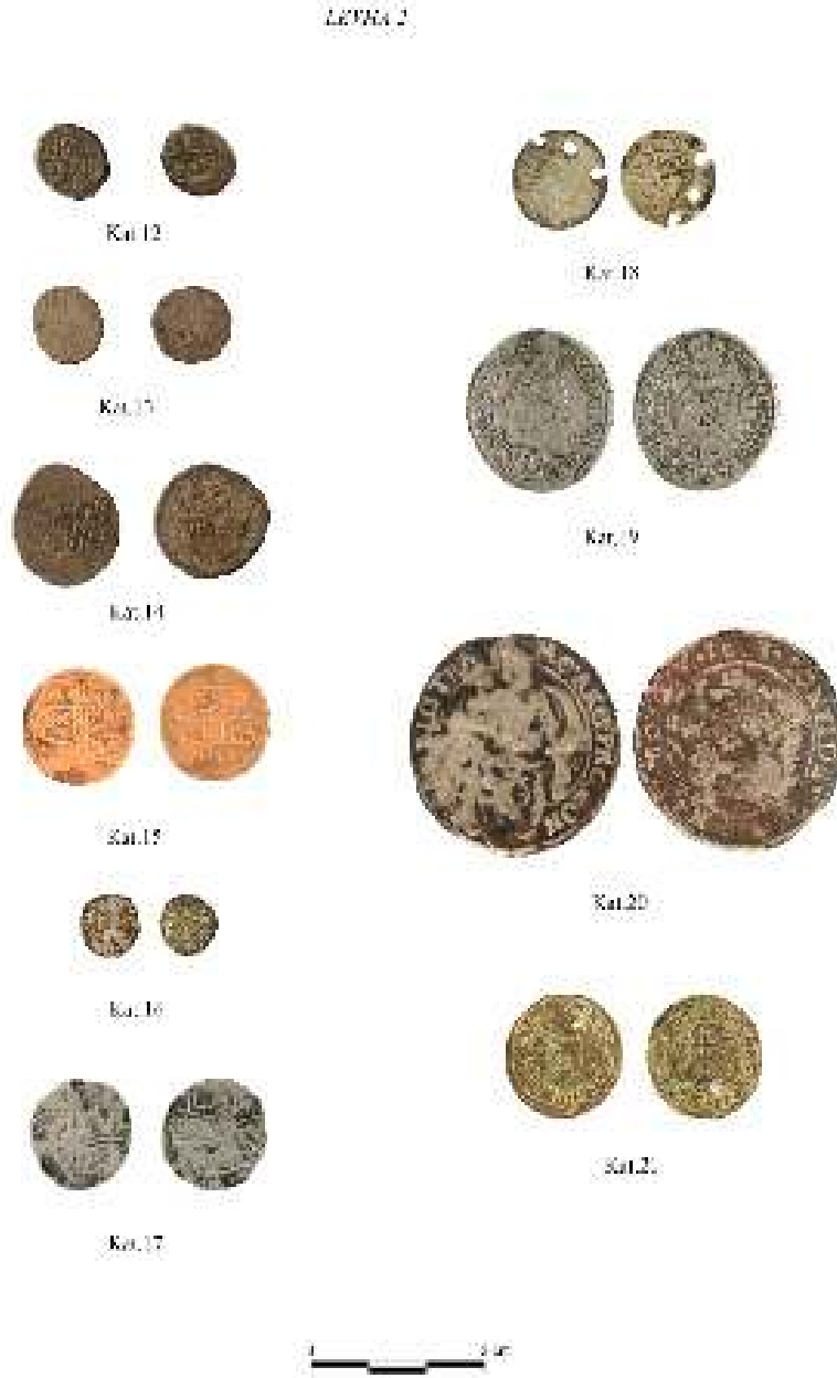
Foto 2: Silifke Kalesi 2020 yılı kazılarında ele geçirilen sikkelerin toplu fotoğrafı.