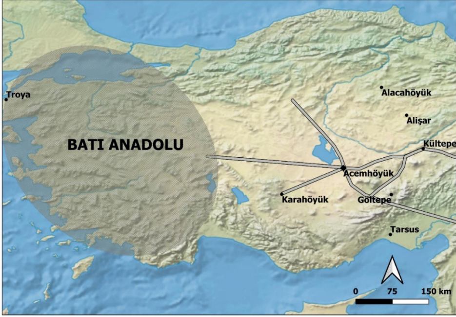
Resim 1: Acemhöyük ve yol güzergahları