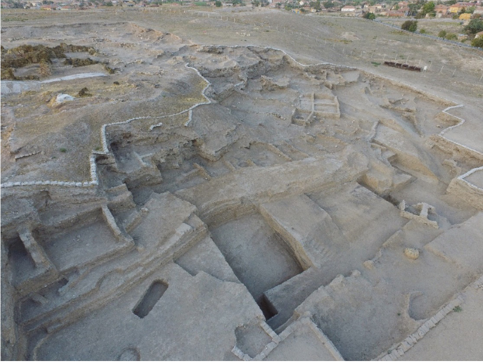
Resim 3: Acemhöyük güney yamaç