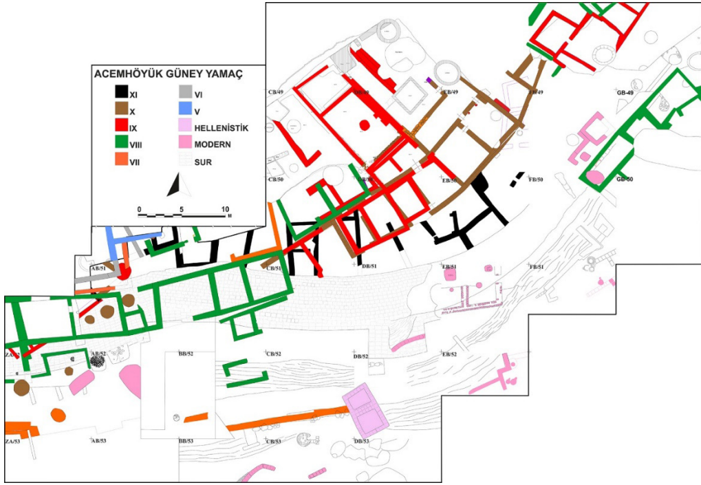
Resim 5: Güney yamaç mimari tabakalar