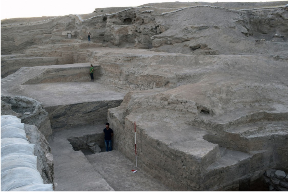
Resim 4: Acemhöyük Erken Tunç Çağı Sur Yapısı