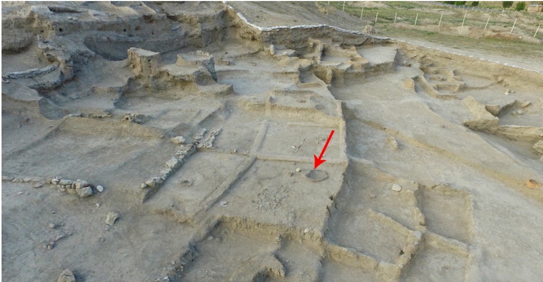
Resim 6: Kırmızı haç motifli çanağın buluntu yeri