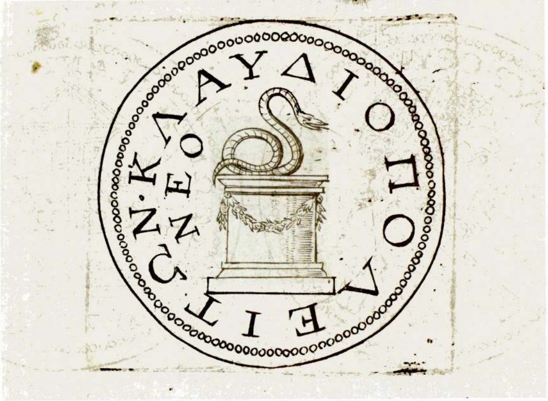
Resim 1. Tristan'ın Commentaires historiques 'in 2. cildinden: bir yüzünde sunak, bir yüzünde yılan olan Karakala dönemi sikkesi (Kral Kütüphanesi, Kopenhag'da).