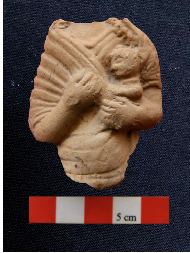
Figür no: 4