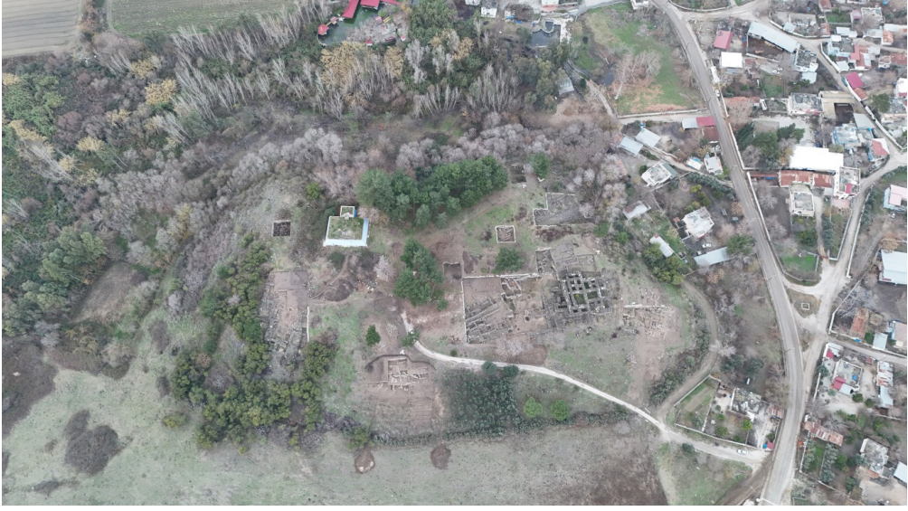
Resim 1. Tatarlı Höyük sitadel yerleşmesi