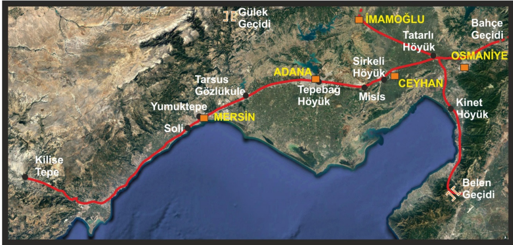
Resim 2. Tatarlı Höyük coğrafi konumu (Cevher 2020, 74, Fig. 5)