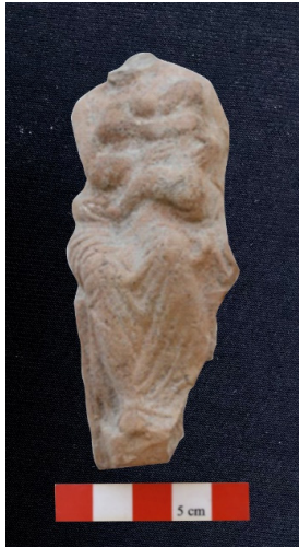
Figür no: 5