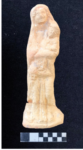
Figür no: 3