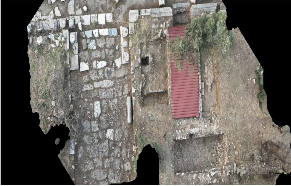
Resim 1. Nysa Doğu Mekânlar