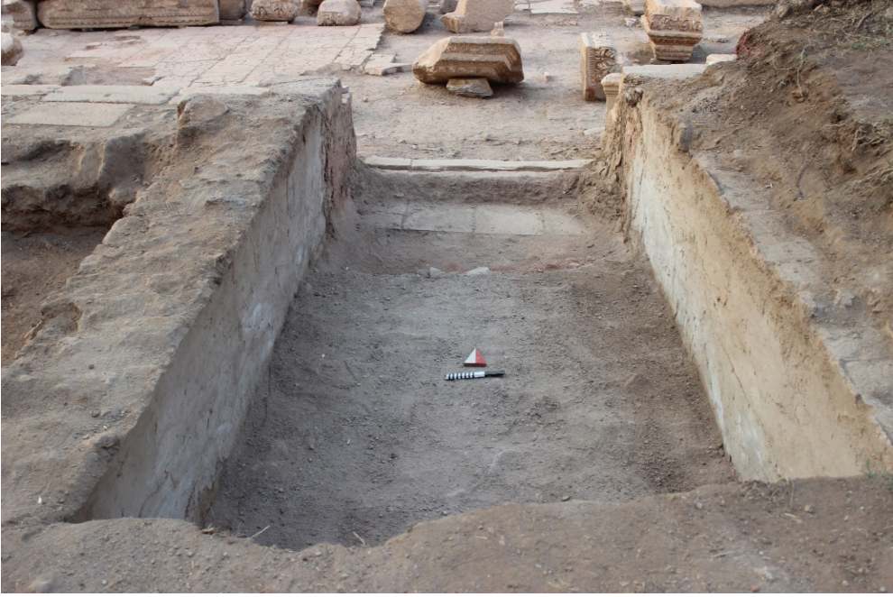
Resim 3. Doğu Mekân 2