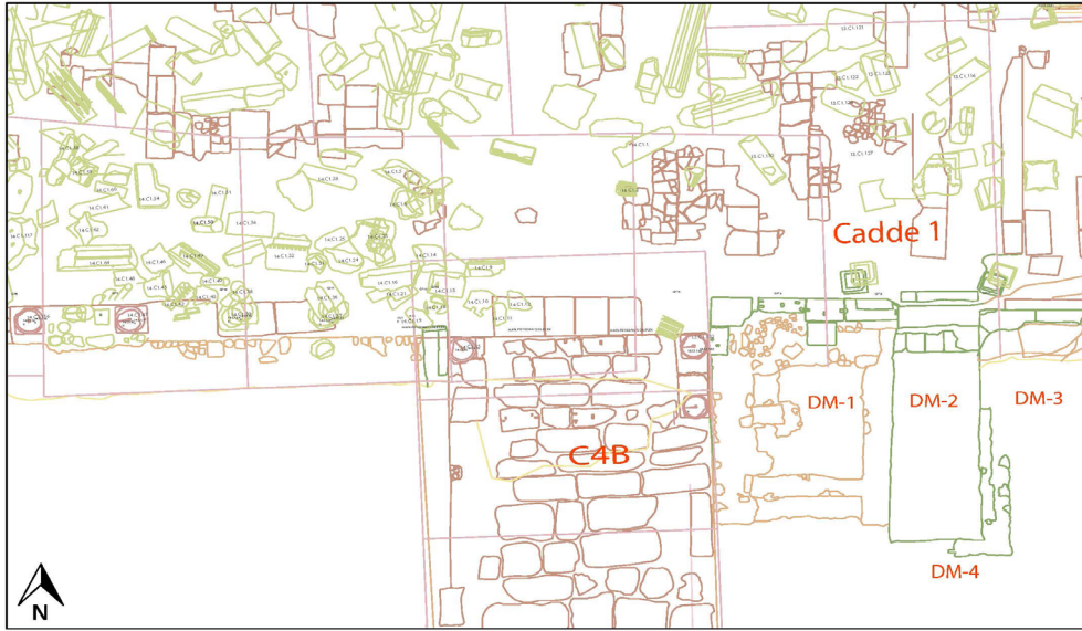
Plan 1. Doğu Mekânlar plan