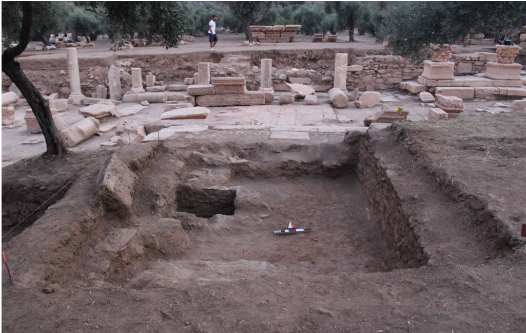
Resim 2. Doğu Mekân 1