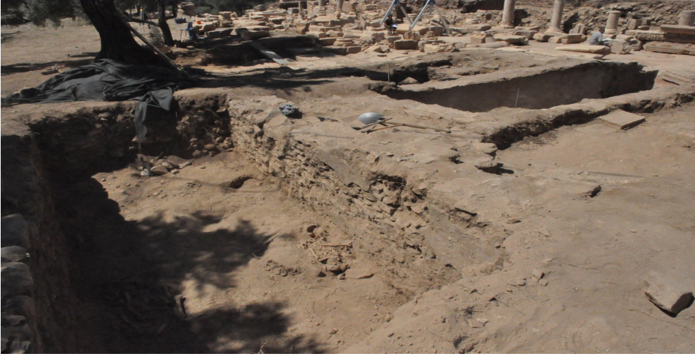
Resim 5. Doğu Mekân 4