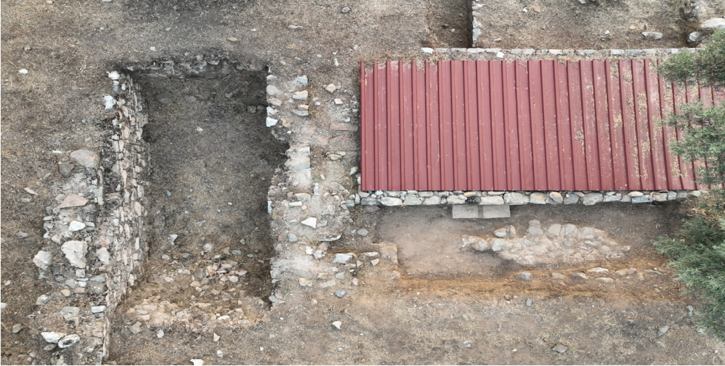
Resim 4. Doğu Mekân 3