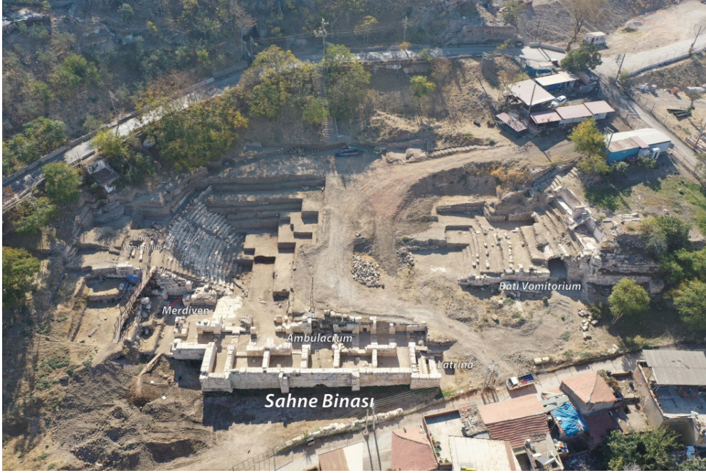
Resim 7. Smyrna Tiyatrosu'nun genel görünümü.