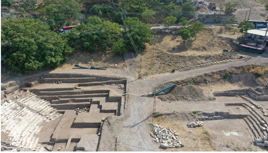
Resim 12. Kazı çalışmaları öncesinde Smyrna Tiyatrosu alanının genel görünümü.