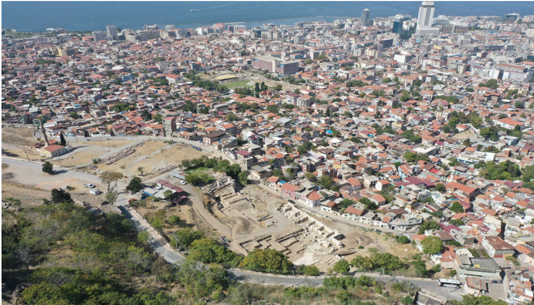
Resim 2. Ön planda Smyrna Tiyatrosu, orta planda Smyrna Agorası ve arka planda İzmir Körfezi'nin genel görünümü.