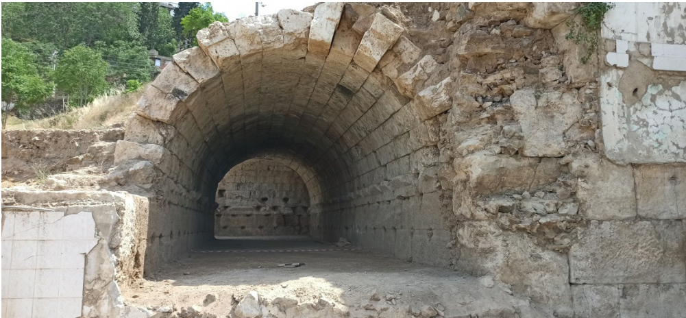
Resim 10. Batı vomitorium iç görünümü.