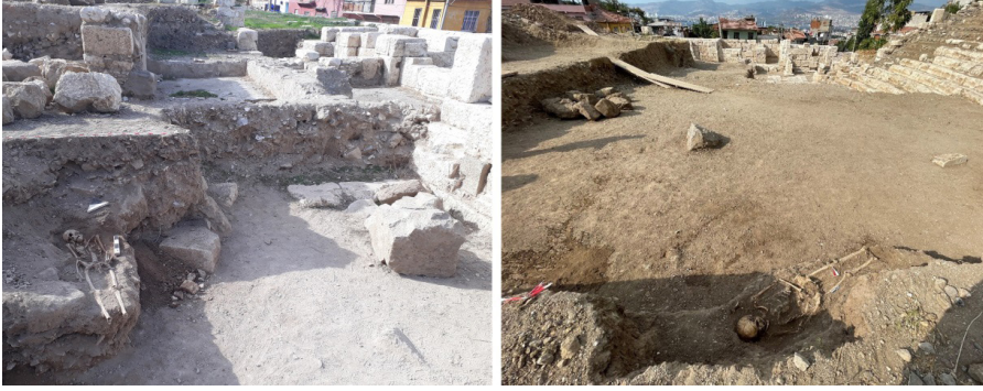
Resim 11. Smyrna Tiyatrosu kazılarında açığa çıkarılan ve 16. yüzyıla tarihlenen iskelet buluntuları.