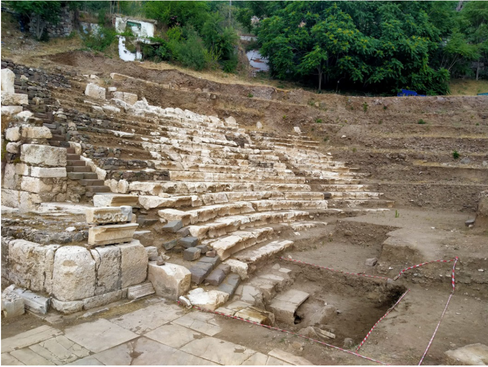
Resim 9. Smyrna Tiyatrosu oturma sıralarının ( cavea ) proskene üzerinden görünümü.