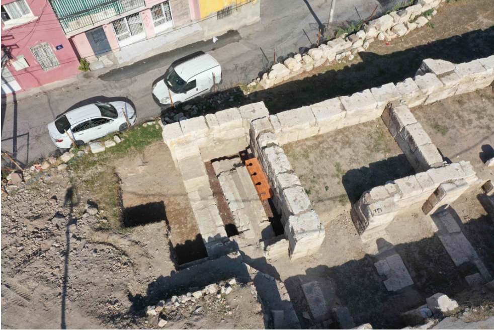
Resim 8. Smyrna Tiyatrosu Latrina 'sı.