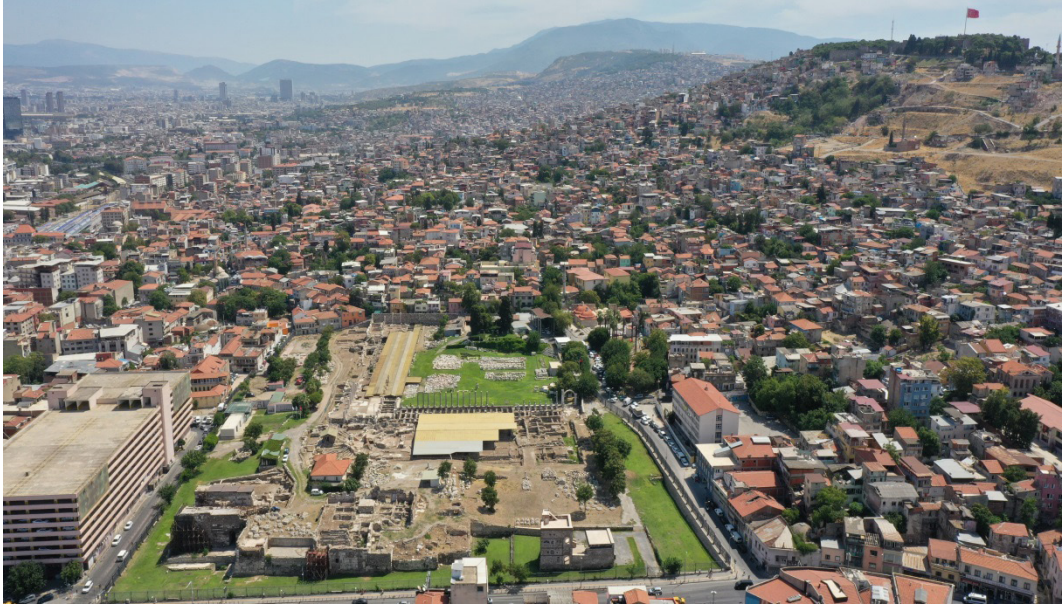
Resim 1. Smyrna Agorası ve arka planda kentin akropolü olan Kadifekale'nin genel görünümü. (Smyrna Antik Kenti Kazı Arşivi)