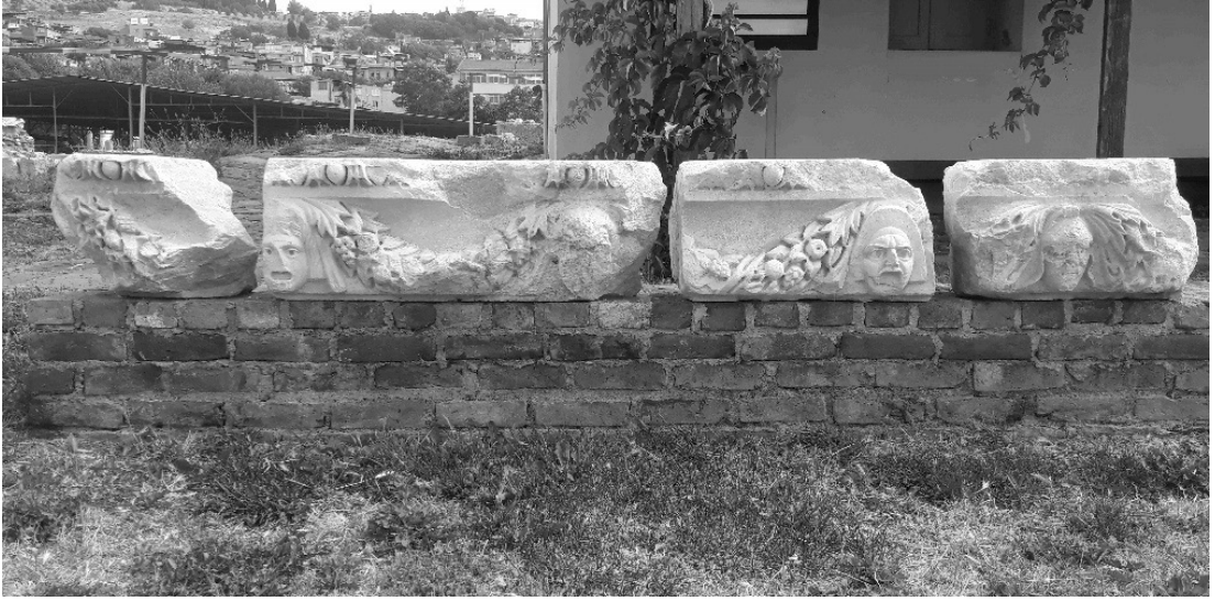
Resim 3. Smyrna Tiyatrosu mask frizi blokları.