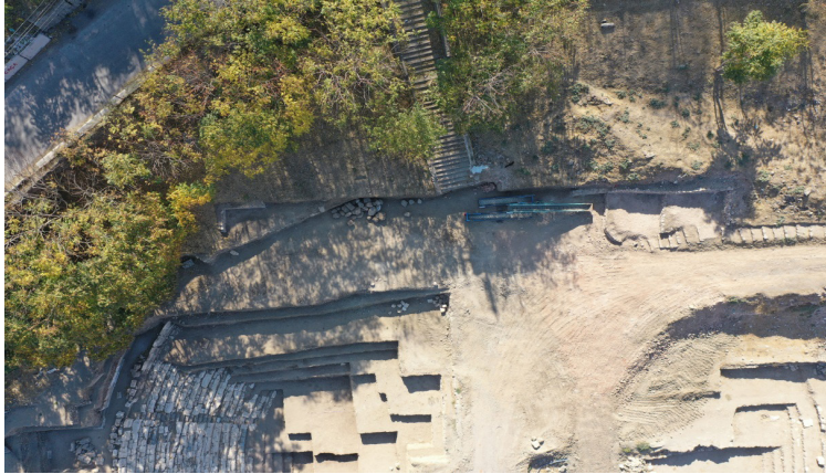
Resim 13. Çalışmalar sonrasında kazı alanının görünüşü.