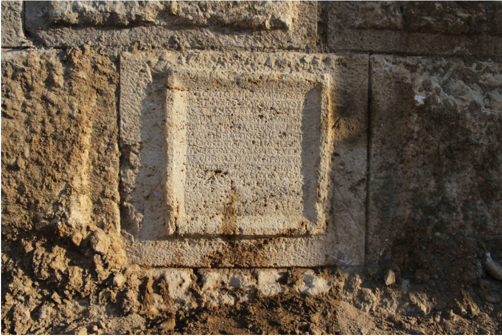
Resim 5. Sahne binası kuzey cephe üzerinde yer alan yazıt. (Smyrna Antik Kenti Kazı Arşivi)