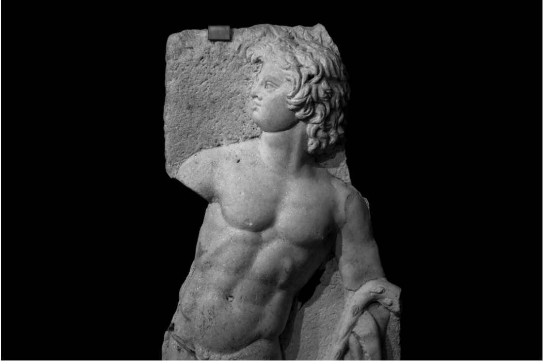
Resim 4. Satyros kabartması.