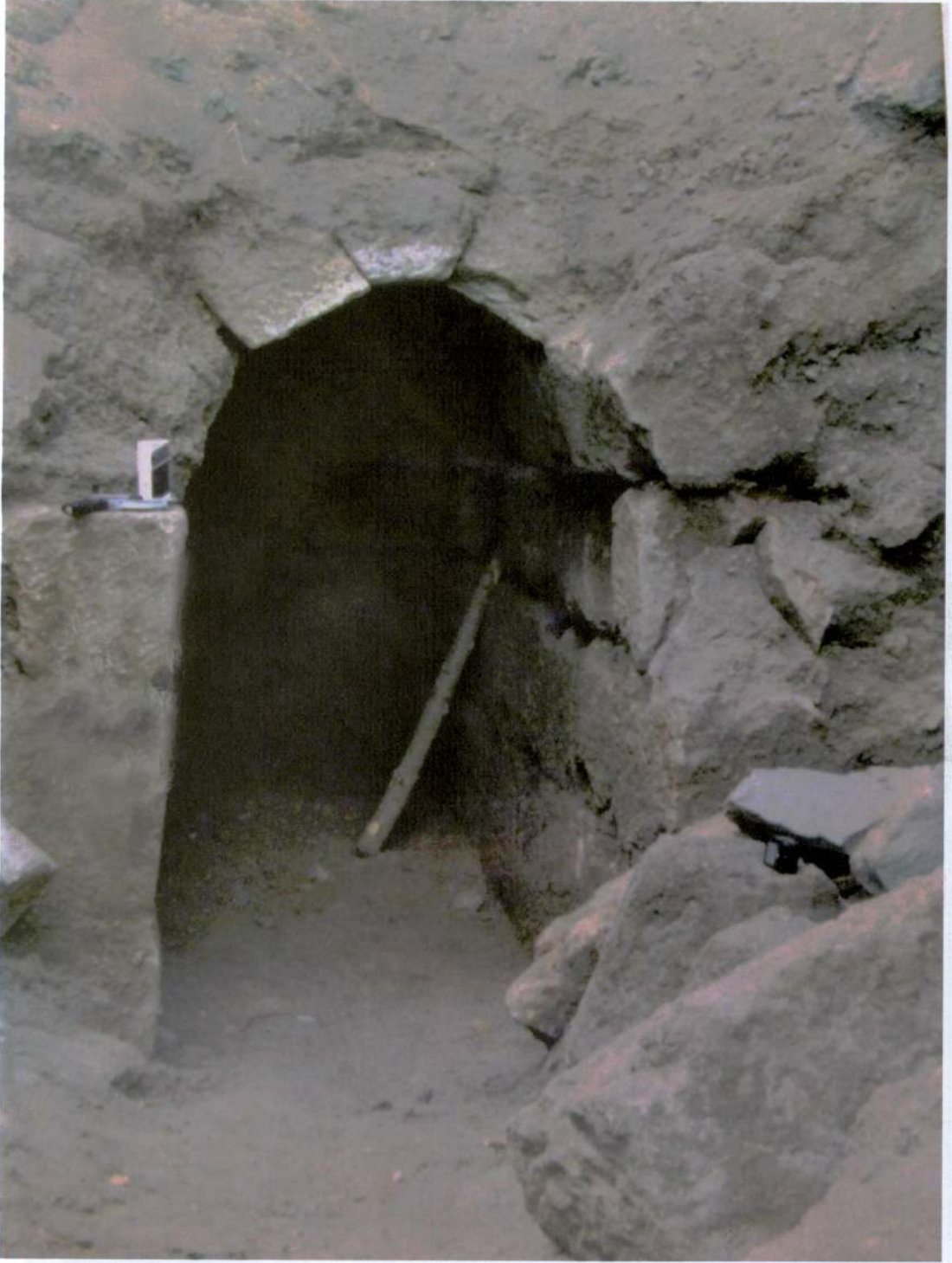
Resim 6: Dromos Girişi.