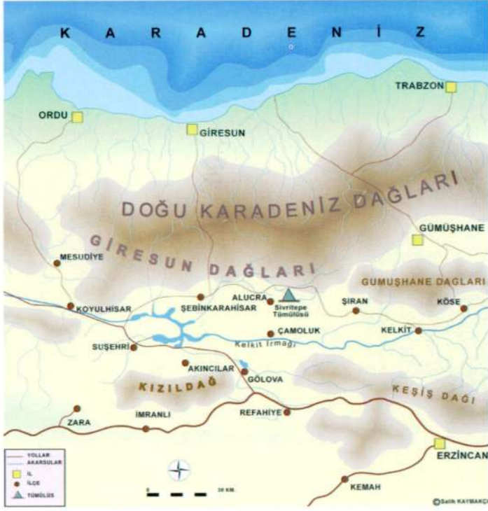
Harita1: Sivritepe Tümülüsü.