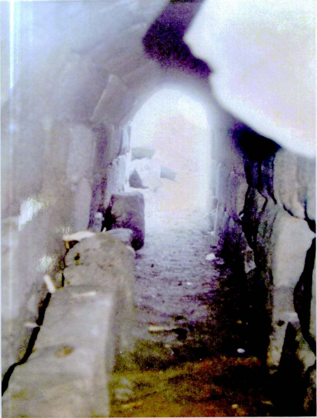
Resim 4: Dromos Çıkışı.