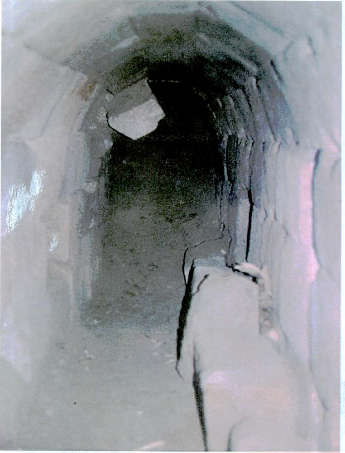
Resim 5: Dromos.