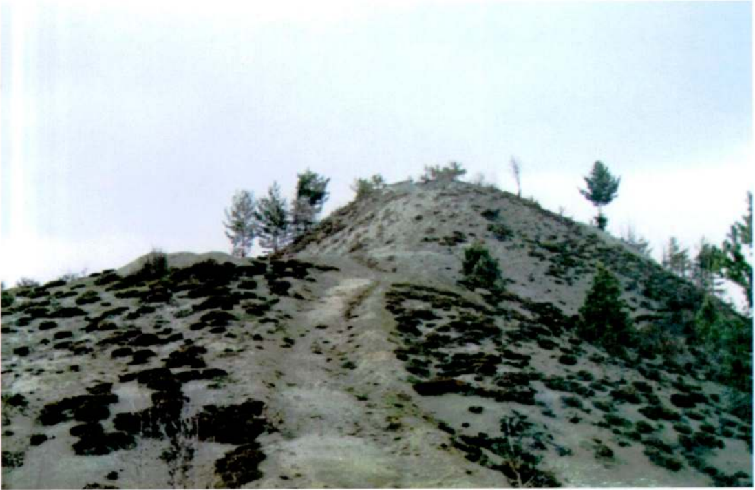
Resim 1: Sivritepe Tümülüsü.