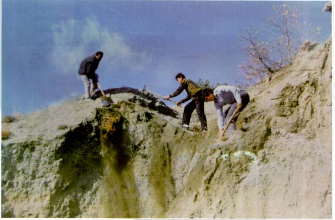
Resim 2: Sivritepe Tümülsü (Giresun Müzesi Arşivi-1992).