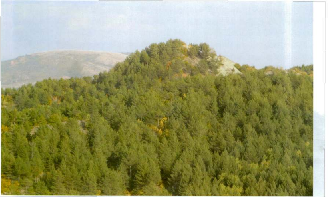
Resim 3: Sivritepe Tümülsü (Giresun Müzesi Arşivi-2003).