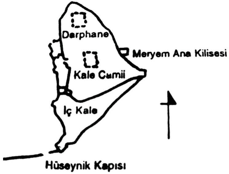
Çizim 3: Danık'a göre Harput darphanesinin bulunduğu yer (Danık 2001).