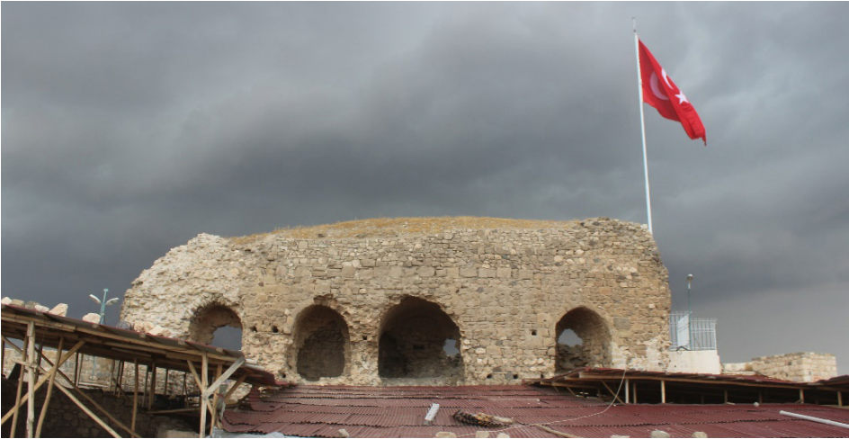
Resim 2: Artuklular Dönemi'nde iç kalenin kuzeyine inşa edilen sarayın kalıntısı.