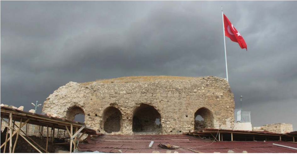
Resim 2: Artuklular Dönemi'nde iç kalenin kuzeyine inşa edilen sarayın kalıntısı.