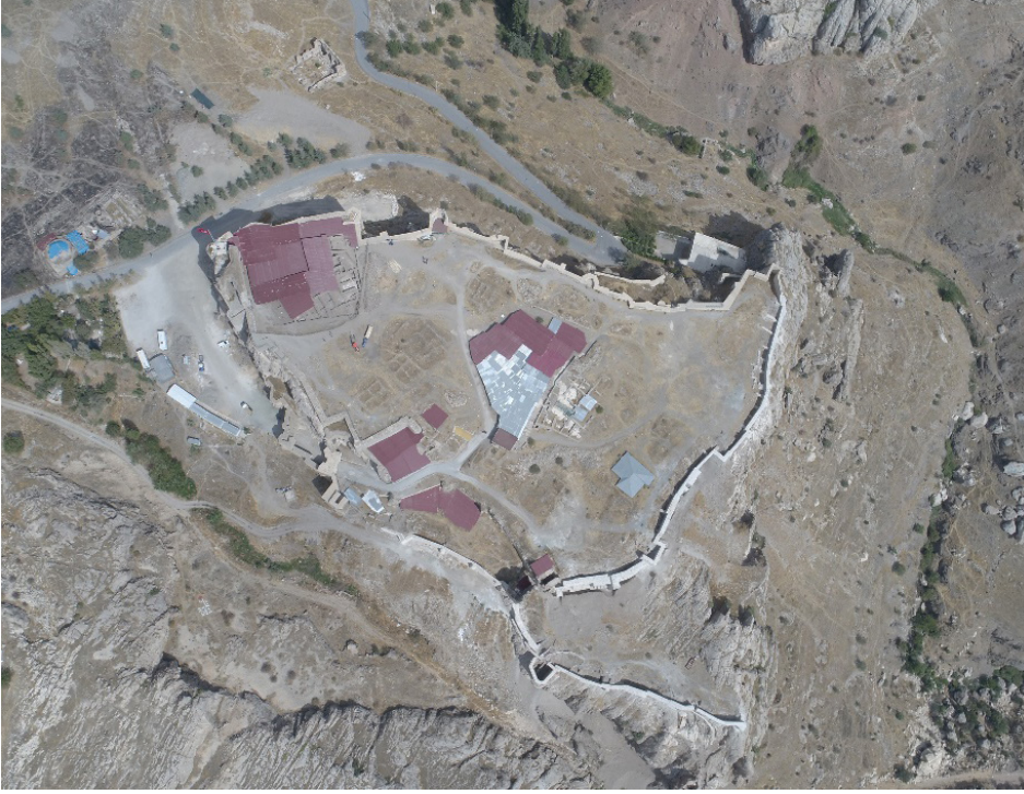
Resim 1: Harput Kalesi hava fotoğrafı.