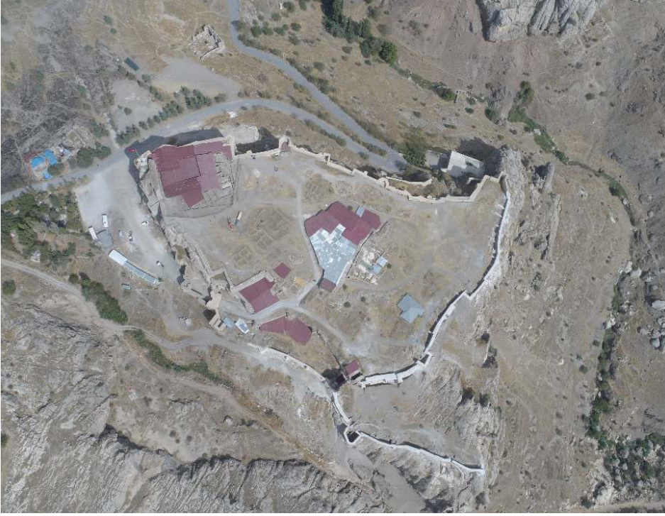
Resim 1: Harput Kalesi hava fotoğrafı.