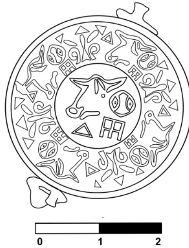
Çizim 2: Ortaköy Mührü-Taban.