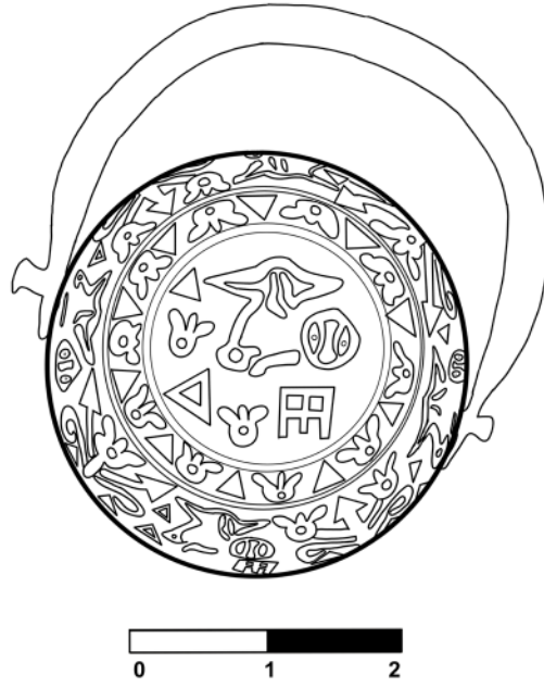
Çizim 1: Ortaköy Mührü-Dışbükey.